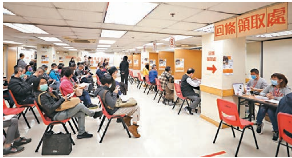
工聯會設立「緊急失業慰問金」昨日有超過7,800人申請。