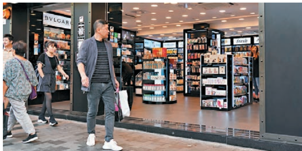
特區政府「防疫抗災基金」下預留56億元推出「零售業資助計劃」，將於下週一起接受合資格商戶申請。圖為九龍一家藥妝店。