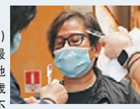
文：香港文匯報記者 鄭治祖、圖：香港文匯報記者

從事接待內地旅客的售貨員鄭小姐(圖)表示，早於黑暴期間已開工不足，加上最近新冠肺炎疫情影響，已失業3個月。她稱自己為家庭支柱，需要照顧年屆90歲的母親，過往也月入萬元，由於經濟不景，再找工作相當困難，申請基金希望暫時紓緩經濟壓力。