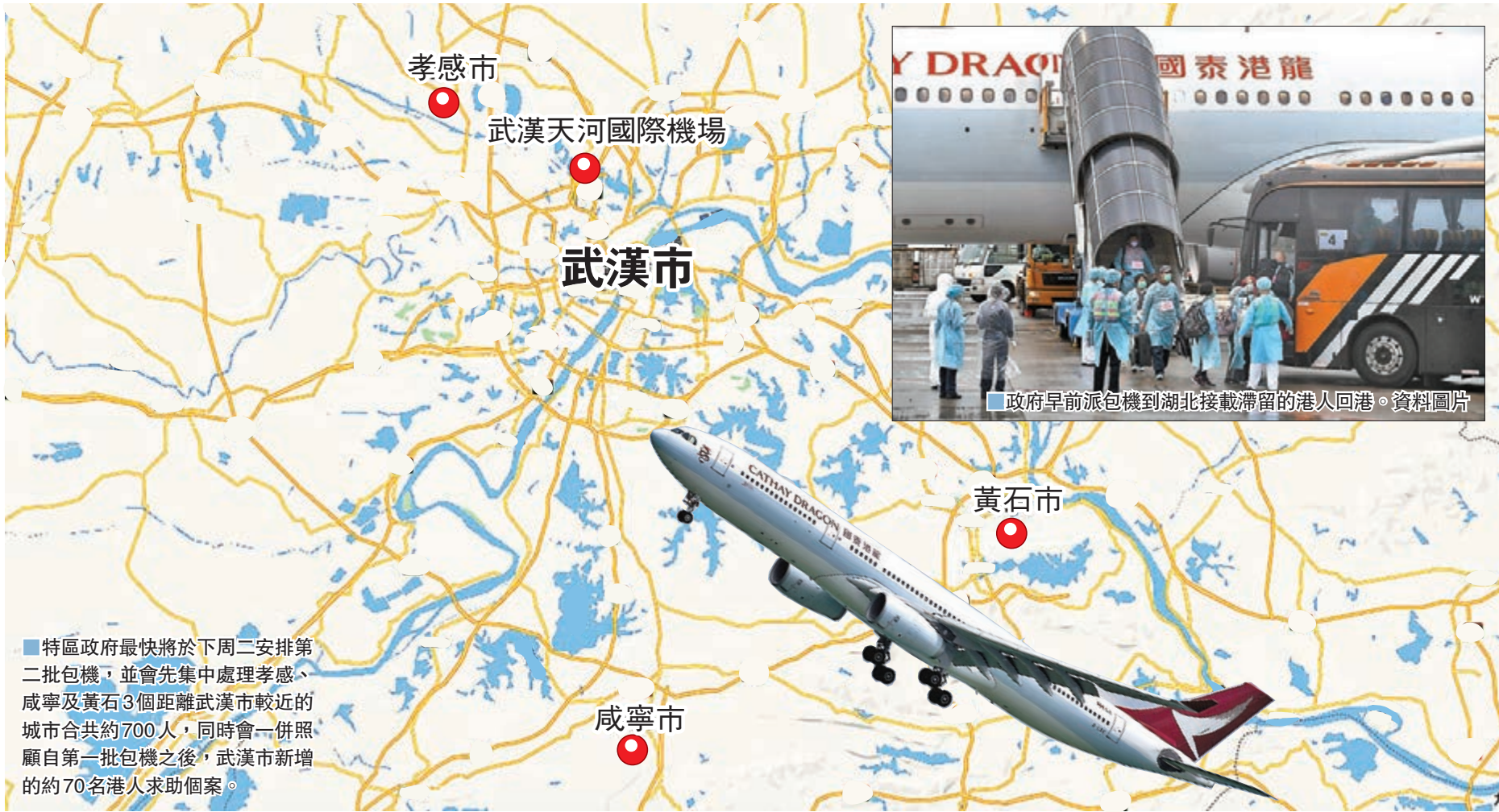
■特區政府最快將於下周二安排第二批包機，並會先集中處理孝感、咸寧及黃石3個距離武漢市較近的城市合共約700人，同時會一併照顧自第一批包機之後，武漢市新增的約70名港人求助個案。

聶德權並指出，因應一些在湖北省有長期病患而需要服用香港藥物的香港居民，特區政府已分批將他們所需的藥物寄到其住處，至今一共寄出13批，合共233名香港居民收到該些藥物。