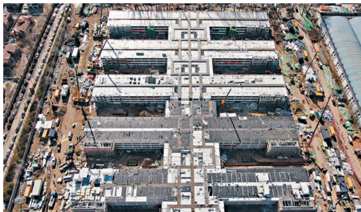
昨日，北京啟用小湯山醫院，用於境外入京人員中需篩查人員、疑似病例及輕型、普通型確診患者的篩查和治療。圖為2月16日，北京小湯山醫院改造工程病房區裝修基本完成。資料圖片

根據官方通報，內地已經出現多起入境時隱瞞健康狀況的個案。最高人民法院、最高人民檢察院、公安部、司法部、海關總署16日發文要求在辦理妨害國境衛生檢疫案件時，應準確理解和嚴格適用刑法、國境衛生檢疫法等有關規定，並依法懲治相關違法犯罪行為。這份意見還明確將被定罪的六類行為，其中包括不如實填報健康申明卡等方式隱瞞疫情等。根據《刑法》，此類行為最高可判監三年。