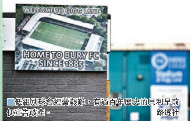
●低組別球會經營艱難，有過百年歷史的貝利早前便宣告破產。

香港文匯報訊（記者 楊浩然）英格蘭各級聯賽因應對新冠肺炎疫情而暫停至4月3日，據英國傳媒表示，各支低組別球會均受到今次聯賽「停擺」嚴重影響，更可能有球會因此面臨破產危機。