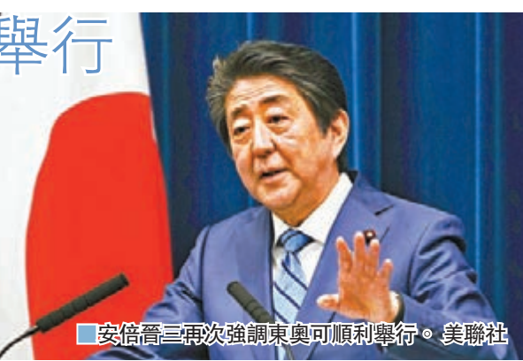
●安倍晉三再次強調東奧可順利舉行。

安倍在發佈會上還說，日本政府會與國際奧委會和世界衛生組織密切合作。言下之意是奧運會能否如期舉行，主動權並不在日本方面。 ■新華社