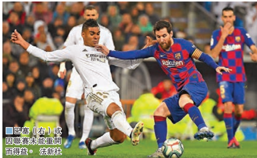
●巴塞（右）或因聯賽未能重開而得益。

問題是，上述四種方案均肯定會有球會反對，其中如宣佈賽事就此結束或只計首循環成績，巴塞隆拿也可宣告奪冠，相信這必受到皇家馬德里的強烈反對；此外，三支目前在降班區域的球隊馬略卡、雷加利斯和愛斯賓奴，在後兩個方案中亦等同宣告難逃降班命運，肯定亦會否定兩個方案。在這情況下，賽會該如何平衡各方利益，以及照顧球員健康，將成為首要解決的問題。