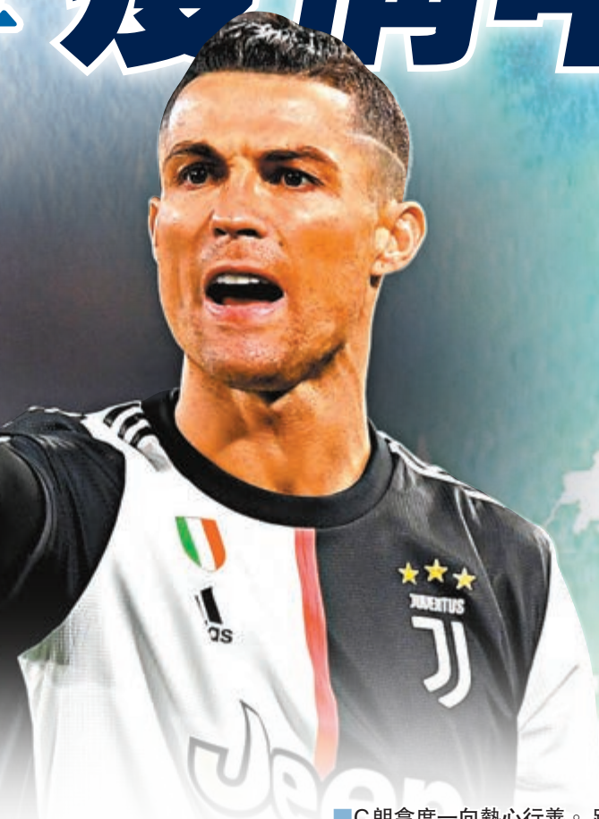
●C朗拿度一向熱心行善。

另外，NBA昨日再有活塞球員基斯甸活特確診新冠肺炎，是聯盟第三位確診球員。眼看疫情嚴重，金州勇士球星史提芬居里亦決定出一分力，與妻子Ayesha宣佈從名下基金會撥款予社區食物銀行，確保倚靠學校進食早、午餐的學童不會因停課而捱餓。居里表示：「我們想