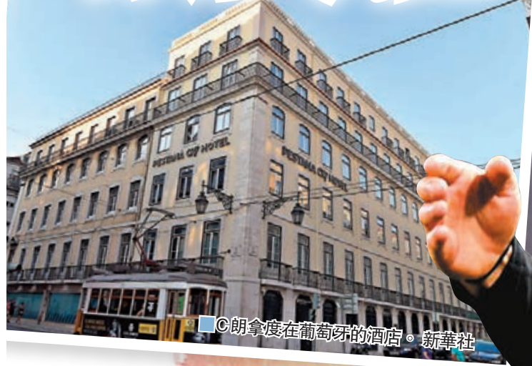
●C朗旗下在葡萄牙的酒店。

新冠肺炎疫情蔓延全球，世界體壇亦因此受到嚴重影響，差不多所有賽事均要宣佈延期舉行；在疫情影響下，無論是依靠運動產業為生的工作人員，甚或普通的低下階層，生活不多不少皆受到影響；有見及此，以基斯坦奴朗拿度（C朗拿度）和美斯等巨星級人馬為首的歐美體育界人士，均紛紛向有需要人士伸出援手，在疫情中送暖。