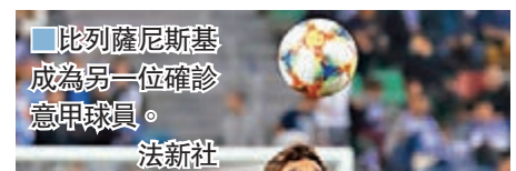
●比列薩尼斯基成為另一位確診意甲球員。

另一方面，法乙球會特魯瓦昨日證實，一名職業球員和一位年輕小將對新冠肺炎檢測呈陽性反應，已在家中自我隔離。