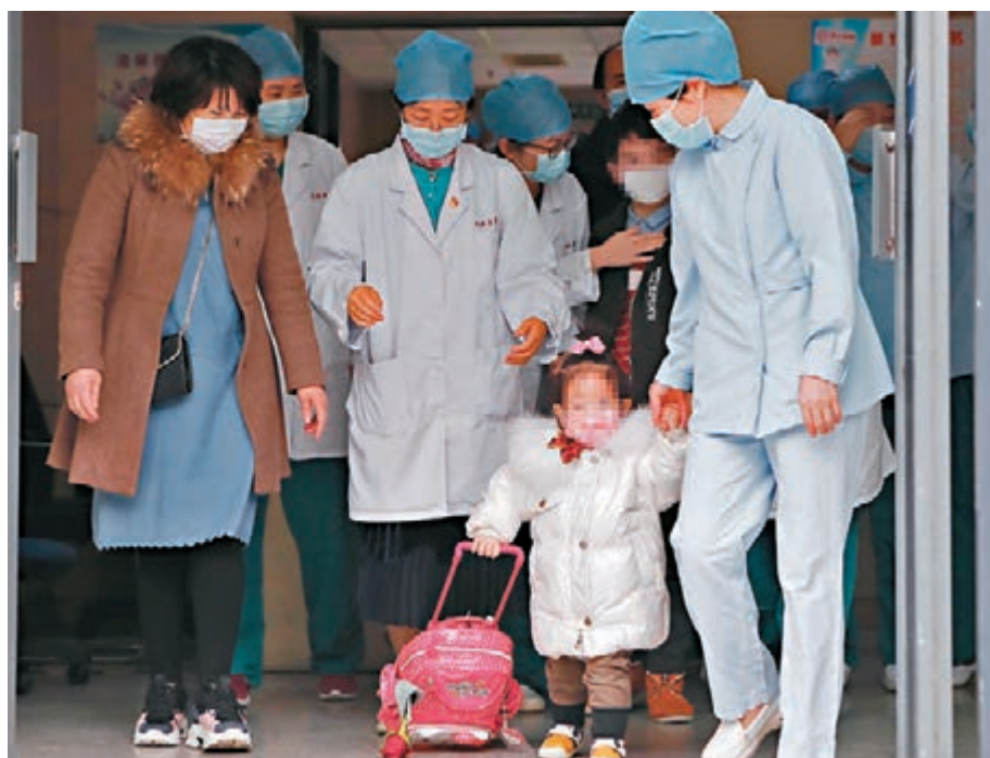
▲《方案》要求，確保確診或疑似感染兒童第一時間送定點醫療機構接受治療。圖為確診患兒痊癒出院。

《方案》強調，各地要把監護缺失兒童救助保護工作納入重要工作內容，完善工作方案，細化制度措施，加強組織保障，強化資金保障，加大政府購買服務力度，切實加強監護缺失兒童救助保護工作，確保不發生衝擊社會道德底線的事件。