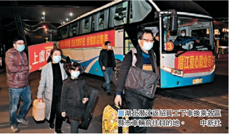
湖北潛江返紹員工下車換乘各區縣車輛前往目的地。