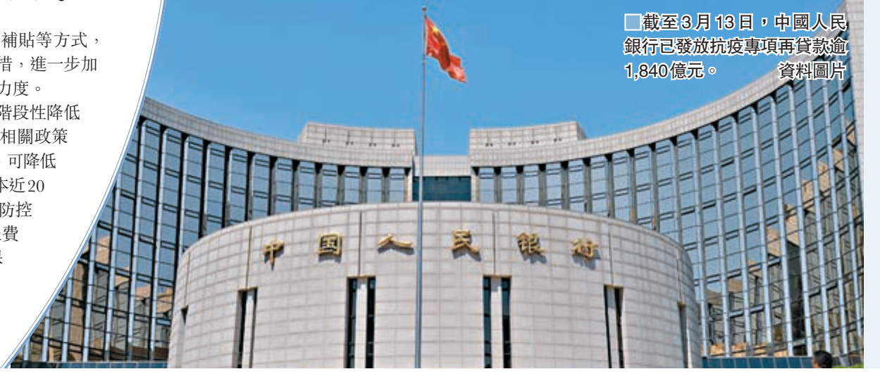
截至3月13日，中國人民銀行已發放抗疫專項再貸款逾1,840億元。

會上，中國人民銀行、中國銀保監會、中國農業發展銀行和中國農業銀行有關負責人就專項貸款投放、扶貧貸款發放等問題回答了媒體提問。孫國峰表示，截至3月13日，人民銀行已發放專項再貸款1,840億元，9家全國性銀行和10個省市的地方法人銀行累計發放優惠貸款1,821億元，平均每戶企業獲得優惠貸款4,000萬元。為支持復工復產，人民銀行於2月26日新增再貸款、再貼現額度