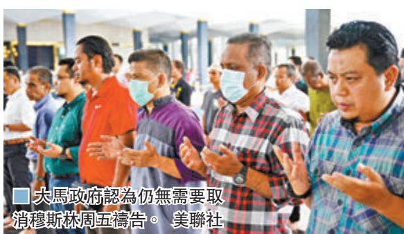
大馬政府認為仍無需要取消穆斯林周五禱告。

大馬衛生部指，過去數日已在大城堡進行大規模檢測及消毒，呼籲國民不要驚慌。當局承認參與集會人士眾多，難以一一追查，呼籲參加者主動到醫院檢查。不過政府認為仍無需要取消穆斯林周五禱告。