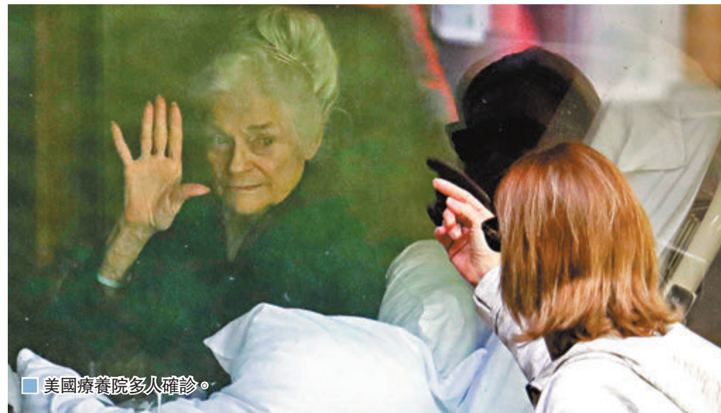
美國療養院多人確診。