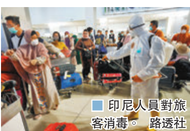
印尼人員對旅客消毒。

印尼政府昨日宣佈，為確保國內口罩供應穩定、以應對新冠肺炎疫情，將暫時禁止口罩出口，直至政府認為供應恢復穩定為止。