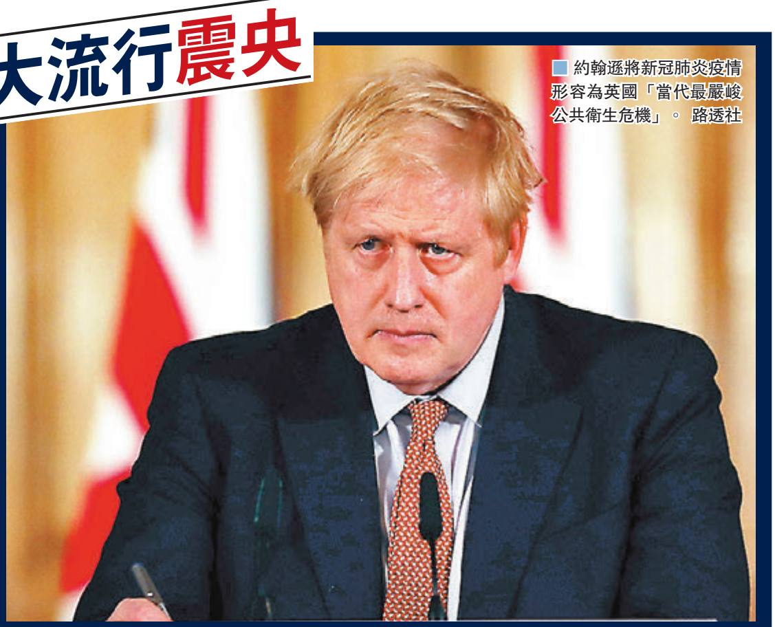
約翰遜將新冠肺炎疫情形容為英國「當代最嚴峻公共衛生危機」。