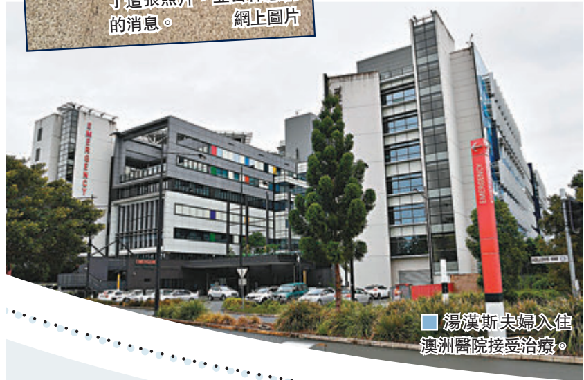
湯漢斯夫婦入住澳洲醫院接受治療。