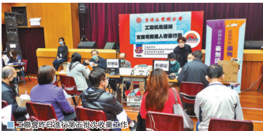
工聯會昨日進行第五批收藥工作。