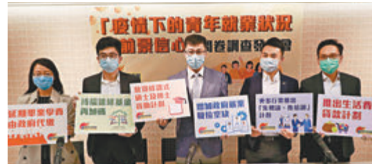
青年民建聯調查發現逾六成受訪青年對未來一年可升職感到悲觀。

香港文匯報訊(記者 郭家好)青年民建聯最新的問卷調查發現，逾六成受訪青年對未來一年可升職感到悲觀，過半青年沒有信心來年能加薪及找到心儀工作。就此，青民將盡快約見政務司司長張建宗，建議政府延後一年償還學債、將持續進修基金加碼至3萬元等，冀於今年大學學年完結前實施。