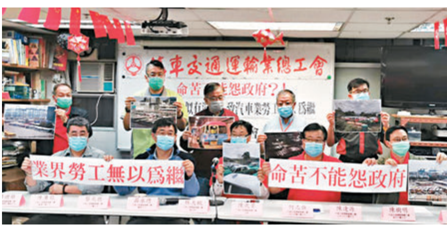
工聯會汽車交通運輸業總會率屬下多個分會代表昨日舉行記者會，指政府推行的多項紓困措施並無針對業界勞工所面對的難題。

工會指出，雖然特區政府成立300億元「防疫抗疫基金」，但推行具體措施時並無針對業界勞工的實際困難，因此提出多項要求，包括在支援措施加入保障行業勞工的條款；設立為期6個月的緊急失業援助基金；向疫情期間收入大減的基層勞工發放1萬元特別津貼；及協助非專利巴士車主延期供款3個月至6個月，而非使用所謂「還息不還本」方案等。