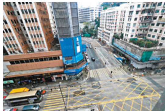
賓館窗外的十字大街，就是捉催淚彈的地方，警察曾舉槍、有人燒電箱。