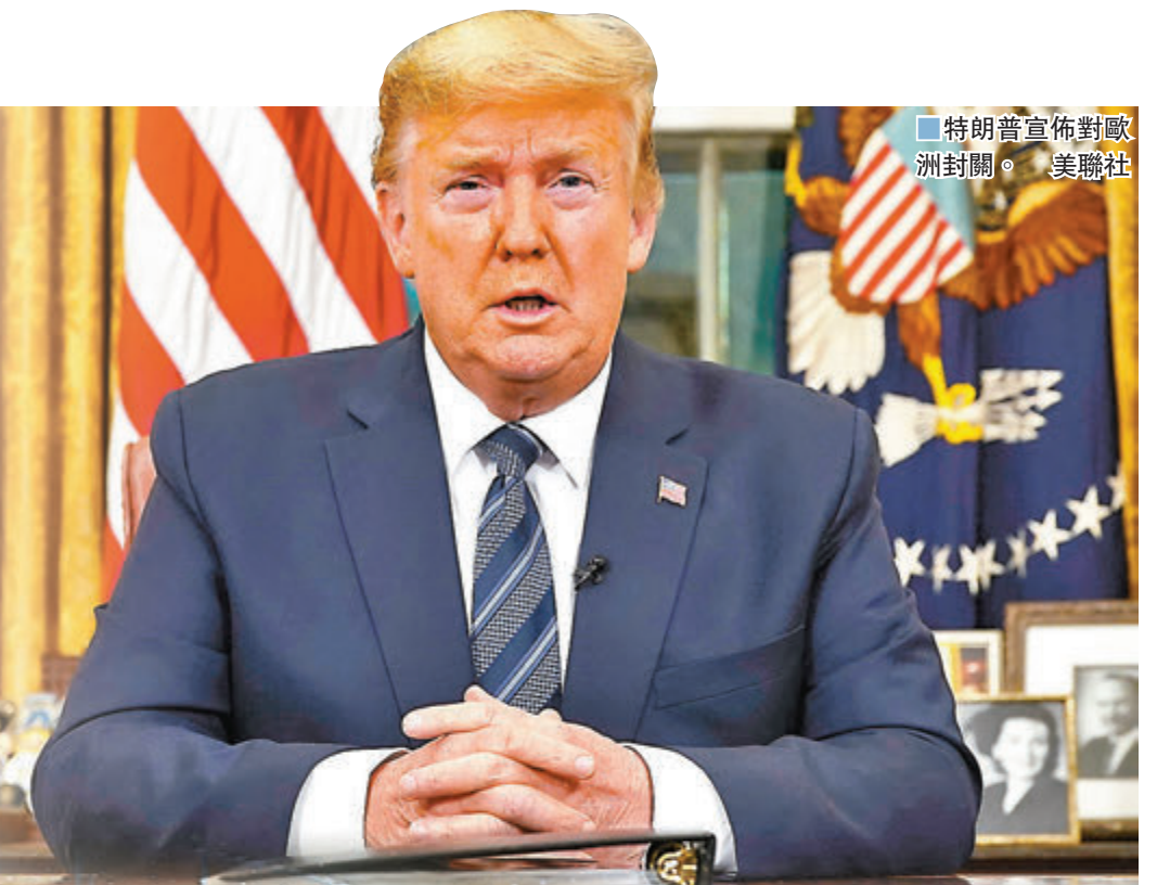
特朗普宣佈對歐洲封關。