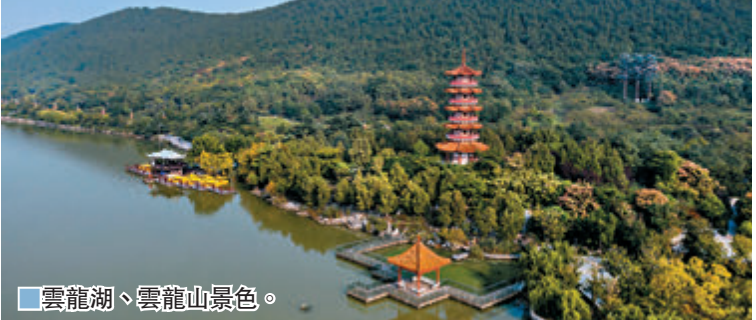
雲龍湖、雲龍山景色。

國家生態園林城市江蘇省徐州市境內的雲龍湖、雲龍山風光秀美，景色如畫。徐州，這座城市曾因煤而興也因煤而困，資源枯竭一度背上沉重的生態包袱。多年來，徐州努力踐行新發展理念，城市涅槃變革，迎來由「黑」變「綠」的生態逆轉。