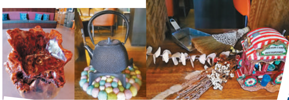
飯店大廳放滿各式各樣的藝術品