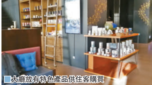
大廳放有特色產品供住客購買

「擁懷天地」即是白魚大師表達內心感受的相對應，看到不捨晝夜的情懷、出世入世的掙扎、貝尼東陽光的溫暖與熱情，運用層層堆疊的古墨，選用大自然的紅珊瑚、藍銅礦及稀有的白鑽粉，並將思維解構再結構，用色彩訴說：如果生命存在是孤寂的，就在無限的孤寂裡，觸動更多溫暖與微笑。