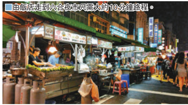
由飯店走到六合夜市只需大約10分鐘路程。