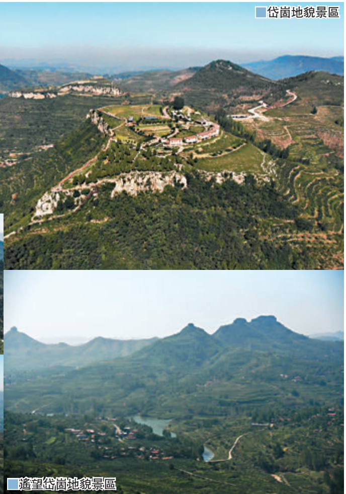
遙望岱嶺地貌景觀區