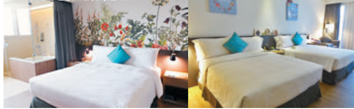
房間設計充滿藝術感

加上，飯店房間種類多，每間房的牆壁都畫有美麗的花花草草，甚至蝴蝶翩翩飛舞，極富自然風格，進入房間猶如走進花花世界。同時，飯店亦設有Mentari小太陽兒童主題房，與台灣木質玩具專家Mentari一同創造安心玩樂空間，更提供兒童備品，女孩款系列有娃娃屋系列、一日店長系列、廚房系列等，而男孩款系列則有城市交通車系列、都市高架車系列、益智系列等，讓親子共享美好時光。