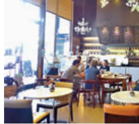
Jessica Cafe 精品咖啡館