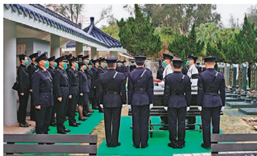
▲海關人員列隊向黎志恒致敬。