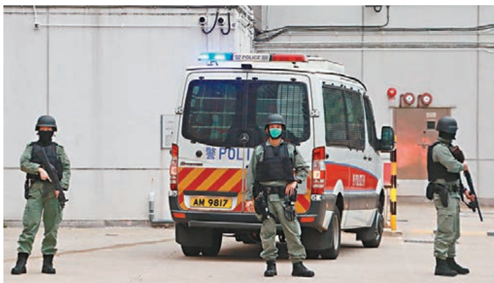
爆炸品案被告準備由囚車押走期間，法院內一度有防暴警手持長槍戒備。