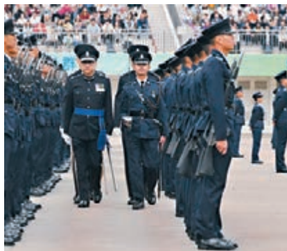
世界正義工程法治指數，香港世界排名第十六位。資料圖片

為進一步鞏固和優化法治，律政司將推展「願景2030—聚焦法治」十年計劃，配合聯合國2030年可持續發展議程下的可持續發展目標，特別是當中着眼於促進法治，確保所有人都有平等