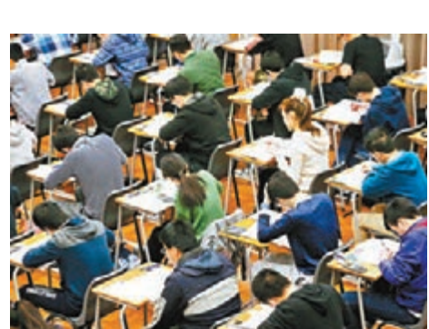
有40名內地考生入境被拒，或無法出席考試。圖為中學文憑試考場。資料圖片

符合14天的強制檢疫要求，同時沒有任何發燒或急性呼吸道徵狀，才能到試場參加文憑試。