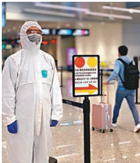
廣州白雲機場對疫情重點國家及地區來粵旅客實行「三色分流」。

香港文匯報訊 據新華社報道，廣州白雲國際機場昨日啟用第二套重點國家及地區航班保障方案，在兩座航站樓內均設定了「路徑最短」的廊橋機位和通道，用於涉及重點國家及地區航班的到港保障。機場方面還與海關、邊檢等單位加強聯動，分區分類前移關口，築牢「外防輸入」的第一道防線。近期，白雲機場每日平均進出港航班已經恢復至500至600班。據悉，白雲機場此次重新調整了國際進港航班流程。對於重點國家及地區直飛廣州的航班，機場方面在T1和T2兩座航站樓設立了以104停機位和146停機位為核心的專屬保障區域。重點國家及地區的航班進港後，所有旅客需第一時間在測溫點測溫，進行檢疫排查和入境手續辦理。機場內設有發熱排查室、緩衝間、流行病學調查室等。只要發現異常旅客，將按照專門流程直接從機坪轉運到指定醫療機構，避免與其他旅客發生接觸。新方案對旅客進行了精細化分類服務保障。重點航班抵達後，檢疫無異常的旅客，會在其護照上貼上「紅黃綠」三色標籤。「紅色」標籤代表目的地為廣東、轉機時間超過12小時或乘坐其他地面交通工具離粵的重點旅客。