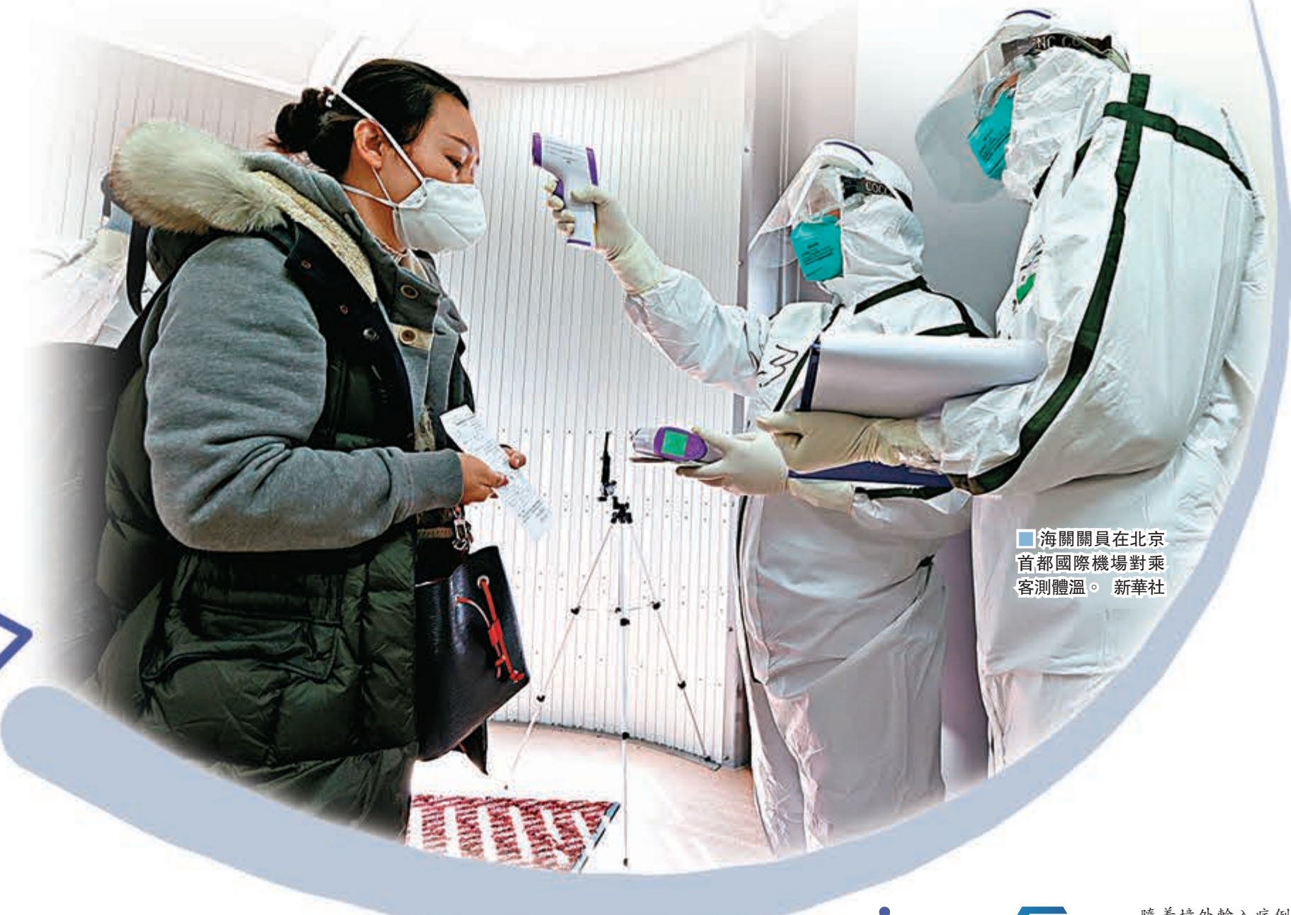
海關關員在北京首都國際機場對乘客測體溫。