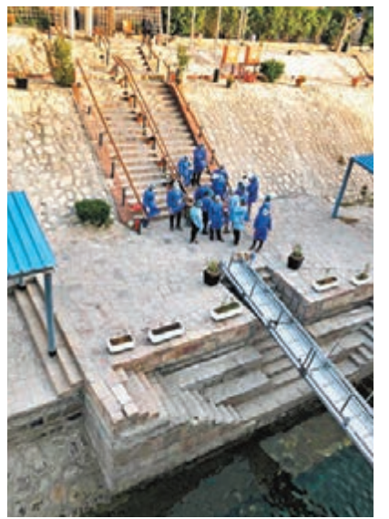
▶埃及醫護人員在岸邊等待對觀光船遊客檢疫。