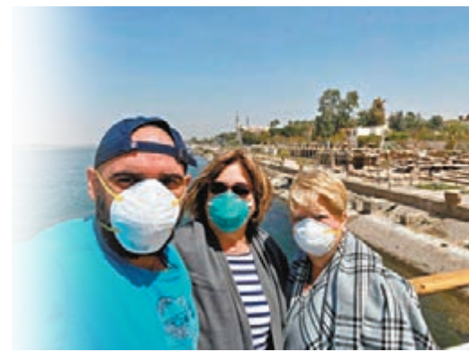
▲3名乘坐埃及「A Sara」觀光船的遊客在船上戴口罩自拍。