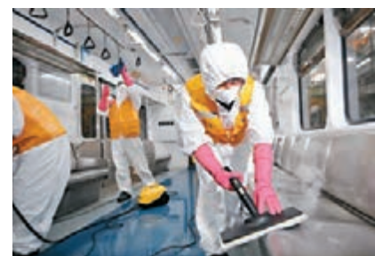
■首爾全副武裝的檢疫人員消毒地鐵車廂。

中8宗由外地輸入，累計病例178宗。通訊及資訊部長易華仁昨日接受訪問時，警告社會在應對衛生風險上不能自滿，需為疫情成為「新常态」作好準備。 ■綜合報道