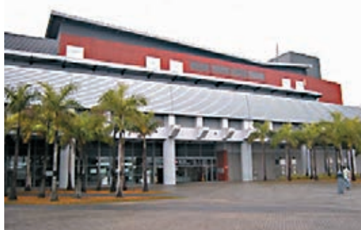
西鐵錦上路站周邊擬建21幢公屋可供9000單位，可容納2.5萬人。資料圖片

的撥款申請，擬議工程可望於2021年展開。相關的工地平整和基礎設施工程預計將於2023年開始分階段完成。