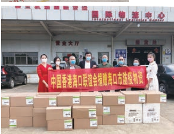
3月3日，中國香港海口聯誼會經香港航空運送68箱防疫物資，捐贈予海口市人民政府。