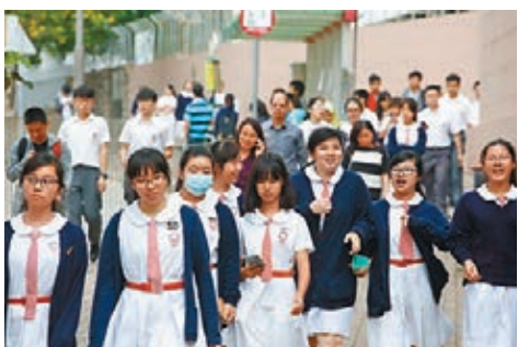
教育局早前宣佈全港學校將不早於4月20日復課。資料圖片

教育局發言人昨晚補充指，派發予考生的50萬個口罩，由於數量龐大須採購自不同產地，其包裝及外觀或略有不同。有關口罩已於本月3日送交考評局，各校可於5日至12