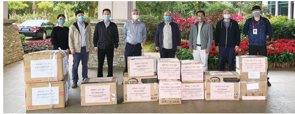
2月21日，香港海南農墾聯誼會、旅港瓊籍鄉親捐贈的11箱防疫物資經香港航空運送，捐贈給海南省人民醫院、海口市人民政府、海南農墾集團等。

自新冠肺炎疫情爆發以來，香港海南社團總會（下稱「總會」）在會長張泰超的領導下，積極響應海南省委統戰部的號召，調動各方資源和渠道，前往美國、澳大利亞、英國、泰國、新加坡等國家及地區，採購海南急需的醫療防疫物資，為家鄉排憂解難，助力全國抗疫。由海南省委統戰部指導、海口市青年創業就業促進會協調，海航集團與香港航空提供了一條瓊港抗疫醫療物資綠色通道，截至3月4日，總會透過該渠道，已運回7批超過1,700公斤的醫療物資，連同其他渠道運送的防疫物資總價值約500萬港幣，包括外科口罩、N95口罩、乳膠手套及體溫槍等。