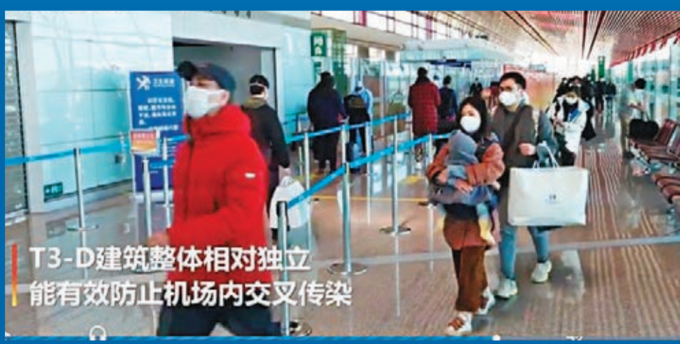
T3-D建筑整体相对独立 能有效防止机场内交叉传染