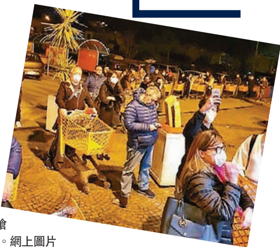
民眾晚上趕往超市搶購日用品。網上圖片