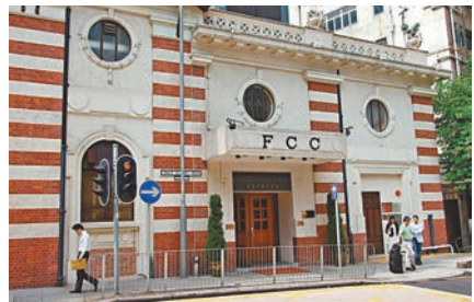
■香港外國記者會早前有會員確診，昨起關閉會所。資料圖片

香港文匯報訊（記者 文森）新冠肺炎疫情持續，香港外國記者會（FCC）昨日發出通告，表示接獲通知指一名會員上星期五確診，該確診會員曾於上月20日的午膳時間，到訪過會所主要休息室（main lounge），事後場地已進行深層清潔，會所並於昨日起關閉，至本周五（13日）重開。