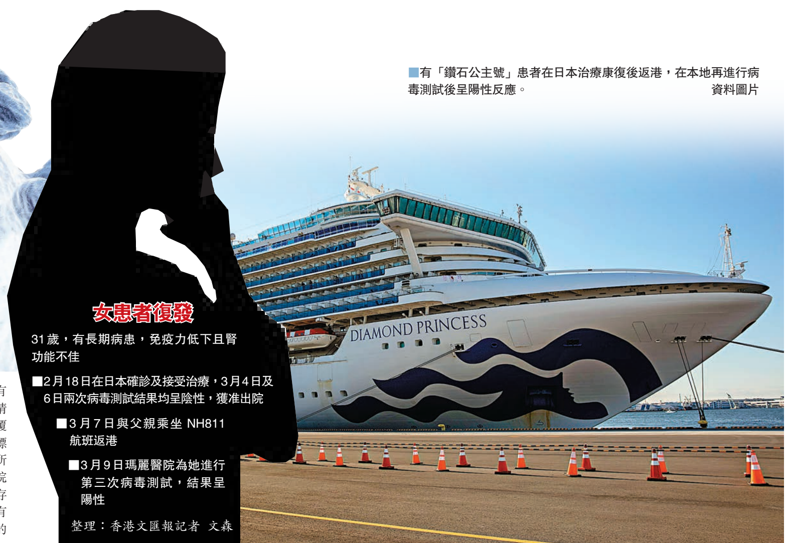
■有「鑽石公主號」患者在日本治療康復後返港，在本地再進行病毒測試後呈陽性反應。

本港昨日新增5宗新冠肺炎確診個案，包括兩宗是印度團感染群組個案及三宗曾到訪埃及旅遊的懷疑海外輸入個案（見另稿）。同日，衛生防護中心昨日證實一名「鑽石公主號」港人確診者，在日本治療及康復並通過對新冠病毒的測試後返港，不久卻再次對新冠病毒呈陽性反應。對於這宗離奇的復發個案，衛生署解釋可能是31歲女患者有長期病，免疫力低，帶病毒的時間較長；與患者同住的父親、兄長及外傭均需入住檢疫中心。醫管局重申，所有香港的康復者，出院後要接受定期覆診，如果病人情況特殊也有可能再做病毒檢測，確保不會讓帶病毒者通行。 ■香港文匯報記者 文森