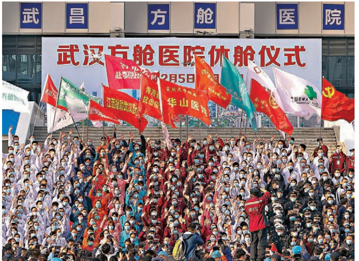
昨日，在武昌方艙醫院舉行的武漢方艙醫院休艙儀式上，醫療隊隊員代表合影留念。