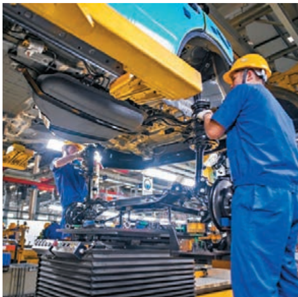
▲疫情導致今年用工荒更為嚴重。市場消息指，比亞迪工人缺口逾2,000人，圖為其生產車間。

香港文匯報訊（記者 李昌鴻 深圳報導）為緩解用工荒，深圳寶安區給予人才中介最高30萬元的獎勵，龍華區的富士康一廠區也給予中介成功推薦一名入職者有7,000元（人民幣，下同）獎勵，吸引不少人才中介積極赴全國各地尋找工人。不過，許多中介表示，現在找工人確實很難。