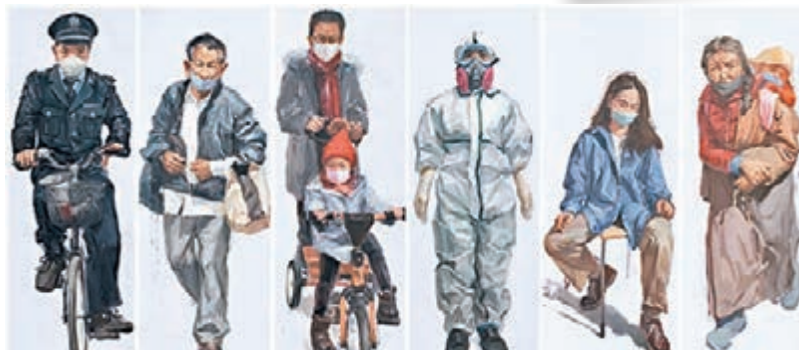
王逸，水粉畫《全民防疫》