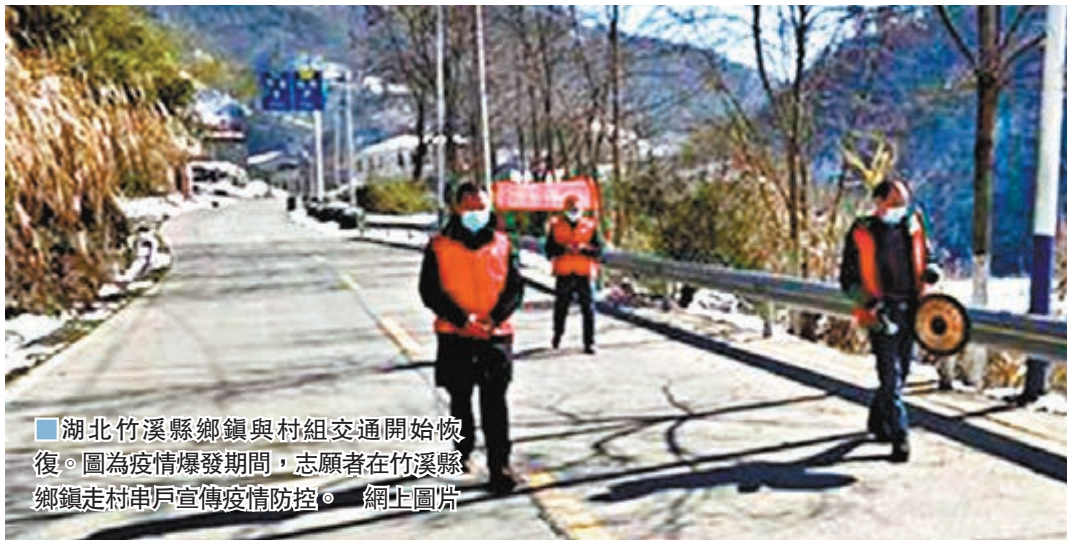
湖北竹溪縣鄉鎮與村組交通開始恢復。圖為疫情爆發期間，志願者在竹溪縣鄉鎮走村串戶宣傳疫情防護。

注重實在實效。領導幹部要善用疫情數據分析，用數據說話，做到心中有「數」。工作不能唱高調、做虛功，不要搞形式漂亮而內容空虛的活動。對工作中的不足不掩飾、不迴避，要作為整改的重點、努力的方向。辦不到的事不說，說了就要兌現，切忌說大話、說空話。