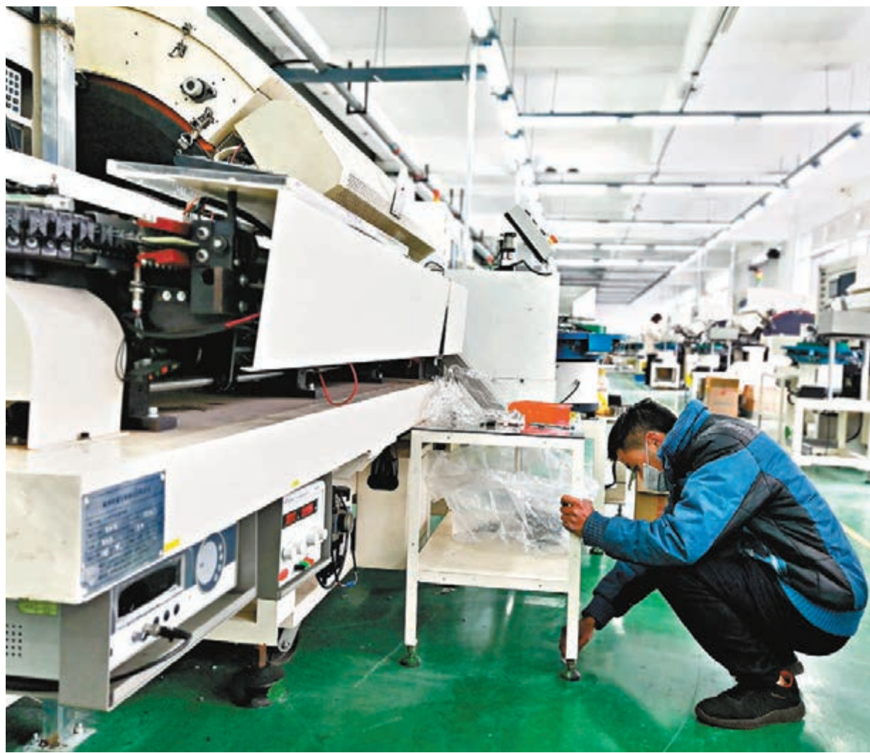
3月8日，位於湖北竹溪縣金鋼嶺工業園區的鈺邦電子（湖北）有限公司開始繁忙起來，該公司40多名工人正在為企業復工復產忙碌著。

另據了解，宜昌秭歸縣、荊州市荊州區、咸寧赤壁市和通城縣等地均開始撤銷各鄉鎮及村組之間疫情防控交通卡口，打通物理隔離，恢復正常通行秩序，但堅持縣域對外繼續封閉。