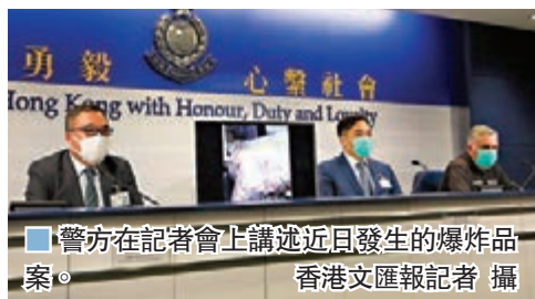
警方在記者會上講述近日發生的爆炸品案。

據悉，警方稍後會聯同不同政府部門進行大規模的反恐演練，提升本港對本土恐怖主義的應變能力及計劃，確保香港警隊有足夠的能力去應付任何情況。警方也會繼續打擊涉及使用爆炸品或真槍實彈的案件。