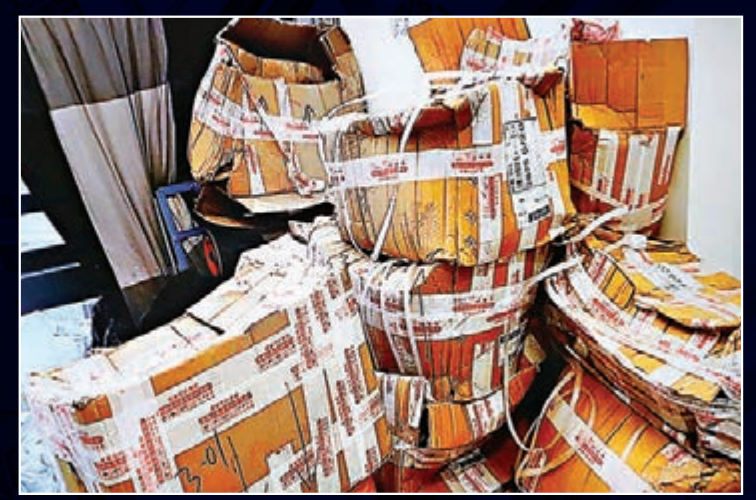
警方在行動中檢獲大批製造炸藥的原料。