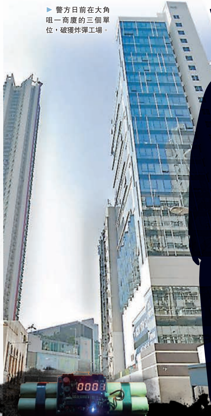
警方日前在大角咀一商廈的三個單位，破獲炸彈工場。