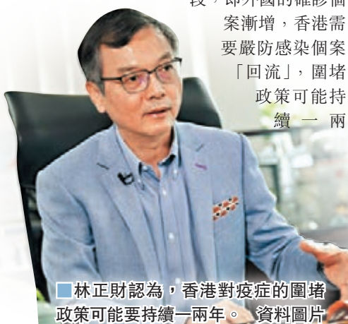
■林正財認為，香港對疫症的圍堵政策可能要持續一兩年。資料圖片

香港文匯報訊（記者 文森）行政會議成員林正財醫生昨日指出，香港的防疫戰即將進入第三階段，即外國的確診個案漸增，香港需要嚴防感染個案「回流」，圍堵政策可能持續一兩年。