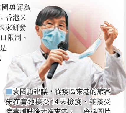
■袁國勇建議，從疫區來港的旅客先在當地接受14天檢疫，並接受病毒測試後才准來港。

至於疫苗及藥物，袁國勇認為要完成研發需時一兩年；香港又沒有疫苗廠，即使其他國家研發成功，香港也可能被出口限制，有關藥物及疫苗可能是「有錢都買唔到」。他又補充，港大測試發現本港確診者出院後血液內抗體含量很高，推測他們受感染後至少可免疫5年至10年。