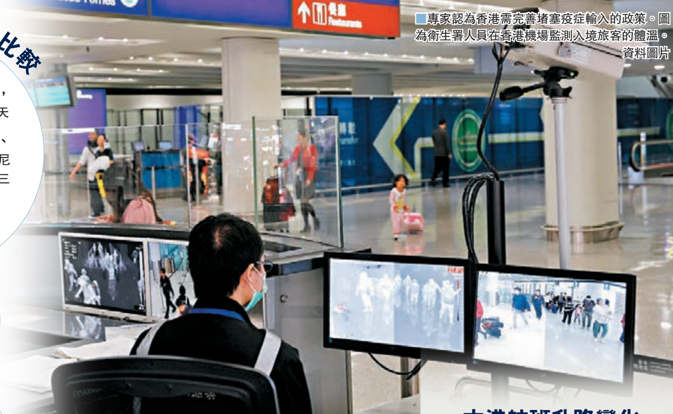
■專家認為香港需完善堵截疫症輸入的政策。圖為衛生署人員在香港機場監測入境旅客的體溫。資料圖片