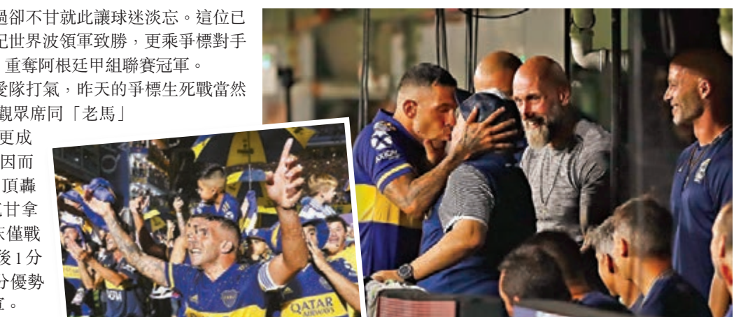
▲泰維斯賽前同馬拉當拿互嘴。