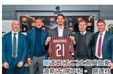
■波班(右三)之前與加斯蒂斯(左)鬧不和。

意甲豪門AC米蘭7日宣佈，波班不再擔任球會首席足球官一職。作為A米名宿，前克羅地亞國腳波班曾在國際足協任職，本賽季前進入「紅黑軍」管理層，但由於與行政總裁加斯迪斯的矛盾，波班與球會的緊張關係持續已久。波班之前在一次採訪中抨擊加斯蒂斯私下邀請RB萊比錫的朗尼克出任主教練，言論引來球會不滿。