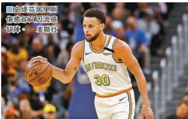
■史提芬居里剛傷癒卻又因流感缺陣。