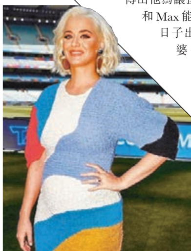
Katy Perry 腹部明顯隆起。