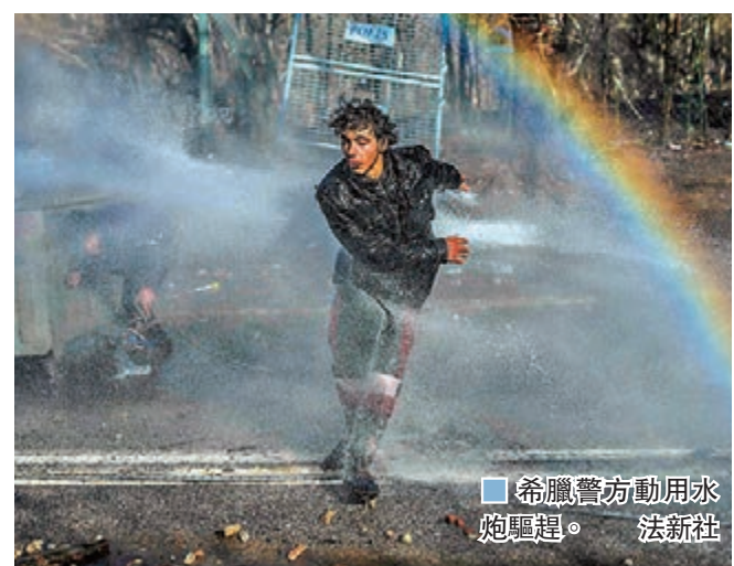
希臘警方動用水炮驅趕。法新社

德國柏林前日約有1,000人在內政部大樓外集會，要求德國政府收容滯留在希臘邊境的難民，其間高舉寫上「歐洲，不要殺人。開放邊境，我們有空閒」的橫額。 ■路透社/美聯社/法新社