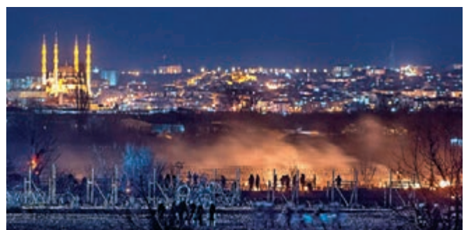
土耳其與希臘邊境如若烽火連天。