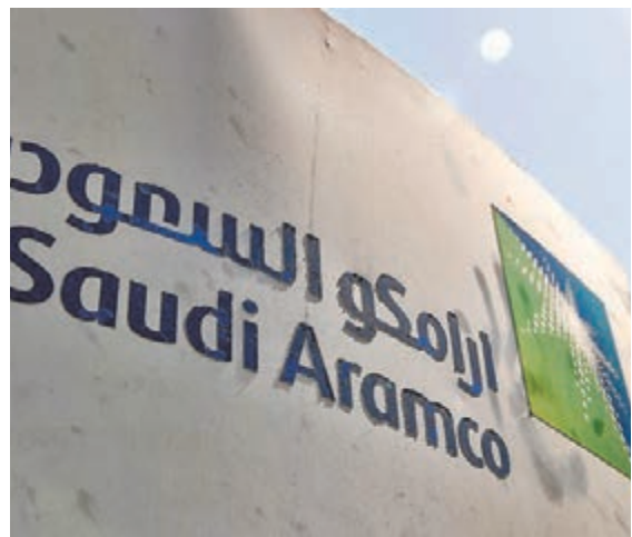
「殺敵一萬，自損三千」，沙特阿美還未正式減價增產，公司股價昨日便已應聲急瀉約9%。

新冠肺炎疫情觸發全球原油價格戰！石油輸出國組織(OPEC)上周與俄羅斯就因應疫情減產的談判破裂後，全球最大產油國沙特阿拉伯立即採取一系列報復性措施，國營石油公司沙特阿美前日宣佈大幅下調4月份原油售價，減幅為30年來最大，當地同時計劃下月起大幅提升產量超過20%，試圖以本傷人的方式，打擊俄羅斯原油銷售，迫使俄羅斯及其他產油國重返談判桌。