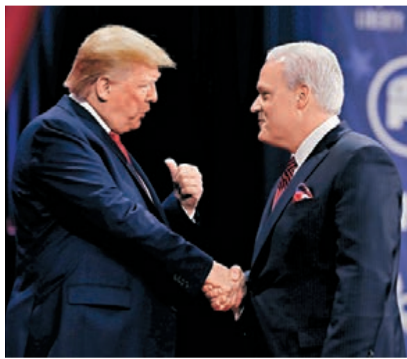
曾與確診者互動的施拉普與特朗普握手。