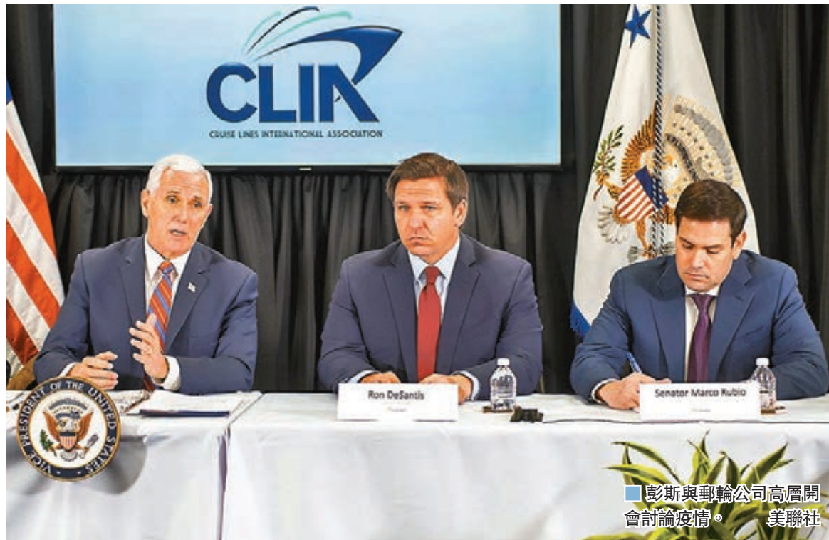
彭斯與郵輪公司高層開會討論疫情。