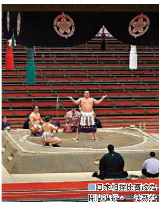
日本相撲比賽改為閉門進行。