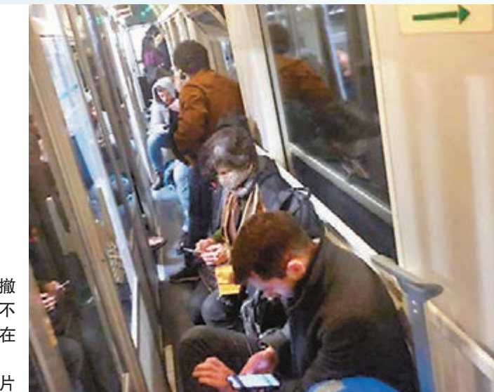
大批民眾撤離封鎖區，不少人只能坐在火車地上。