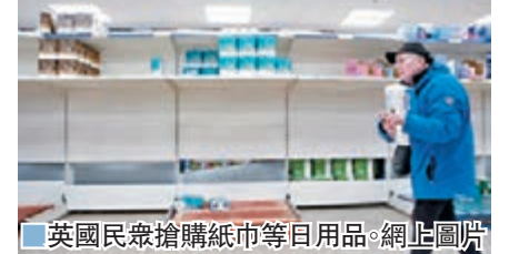
英國民眾搶購紙巾等日用品。