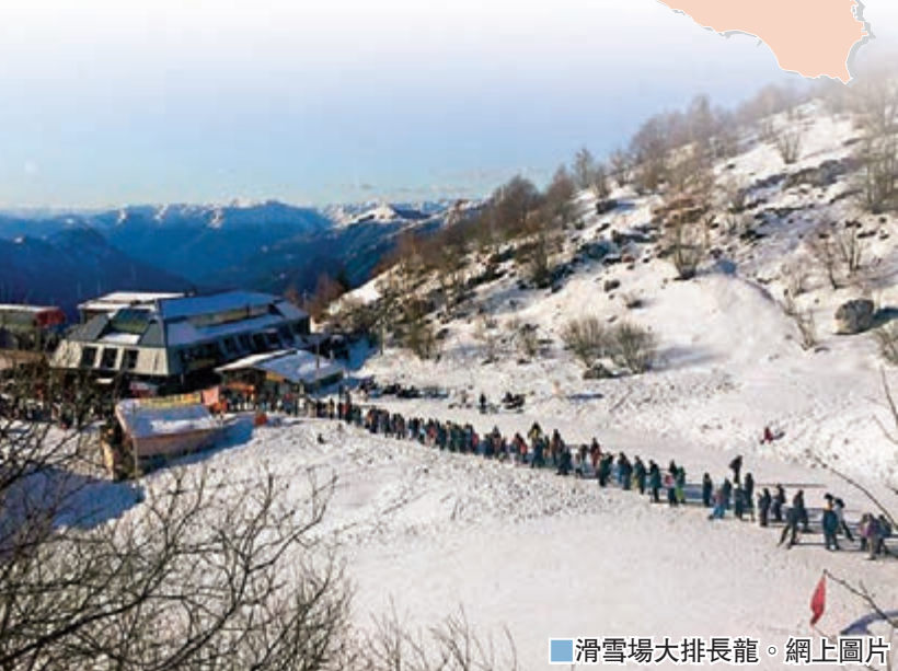
滑雪場大排長龍。網上圖片