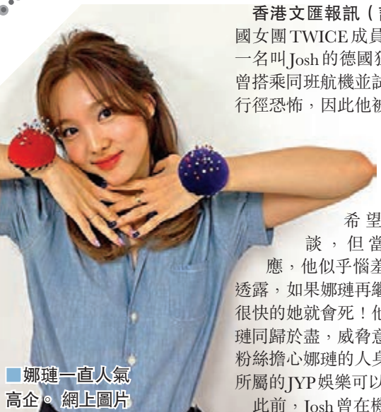
娜璉一直人氣高企。網上圖片