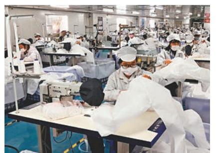
■2月23日，深圳市一家醫療用品企業員工在車間加工防護用品。網上圖片