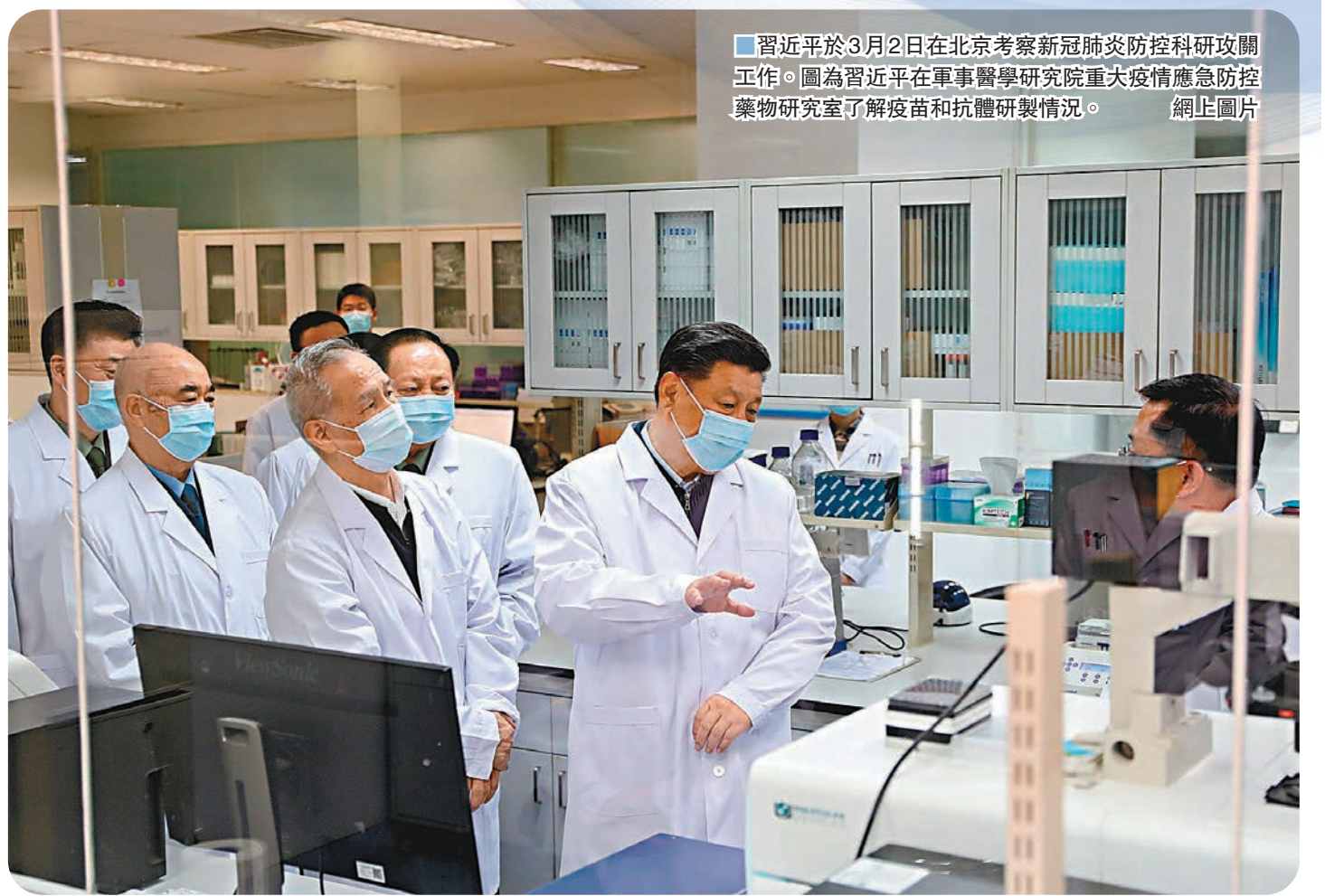
■習近平於3月2日在北京考察新冠肺炎防控科技攻關工作。圖為習近平在軍事醫學研究院重大疫情應急防控藥物研究室了解疫苗和抗體研製情況。