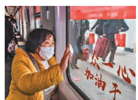
■3月5日，陝西省漢中市勉縣1,400多名務工者在勉縣火車站，乘坐當地政府免費提供的「定製火車」，前往江蘇、上海。

具體工作部署中，抓大不放小，既把握重點又推進全面，既安排近期又籌謀長遠，既鼓舞鬥志又堅定信念：關心「菜籃子」「米袋子」，在緊張的戰「疫」期間專門對春耕工作作出重要指示；心繫「復工復產」「產業發展」，習近平指導落實分區分級精準防控策略，打通人流、物流堵點，鼓勵改造提升傳統產業，培育壯大新興產業；關注「脫貧攻堅」「對外開放」，習近平強調「必須再加把勁，狠抓攻堅工作落實」，要求「變壓力為動力，善於化危為機」。