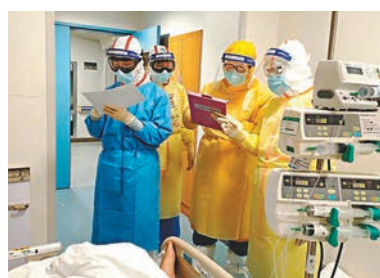
■2月11日，在武漢同濟醫院中法新城院區ICU病房內，來自北京協和醫院的醫護人員在病床旁查房交班。

全軍緊急抽組精兵強將奔赴疫情防控第一線。解放軍三支醫療隊450人在除夕夜馳援武漢；軍隊組織骨幹醫療團隊承擔起火神山醫院