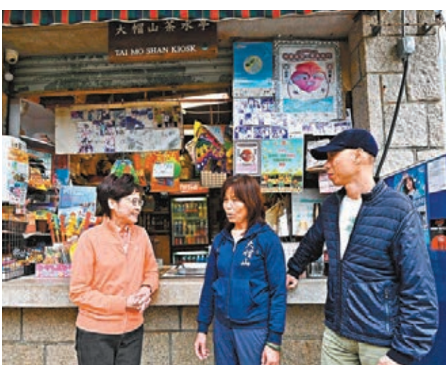
林鄭月娥(左)了解小食亭的經營情況。旁為黃錦星(右)。

林鄭月娥感謝漁護署人員緊守崗位，面對疫情下郊野公園人流增加，前線人員加強防疫和清潔衛生的工作，保障市民健康。漁護署在這段期間也透過社交媒體及夥伴團體的網絡等不同渠道，加強防疫及保護郊野的宣傳和教育工作。