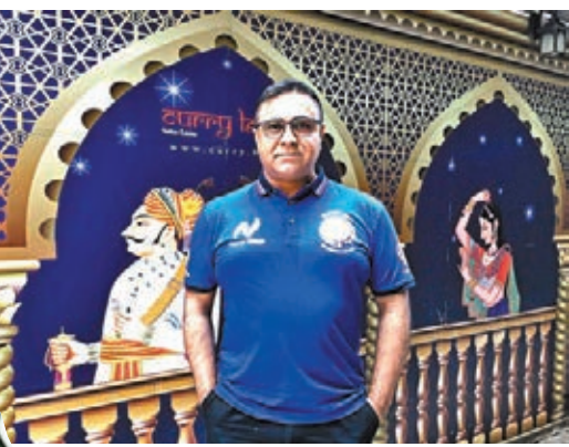
喬寶寶暫緩到蘇格蘭與家人團聚的計劃，選擇留低與港人一同抗疫。