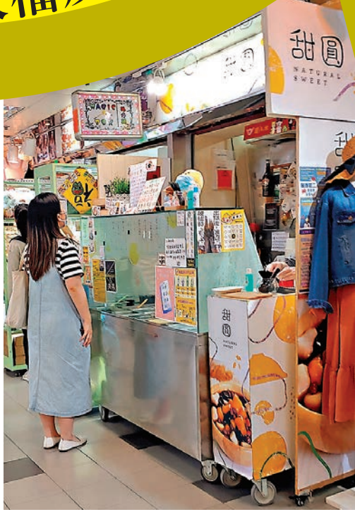
▲「自滅」卻賴商場的「甜圓」。

香港文匯報訊（記者文森）在經濟不景氣的情況下，店舖要持續收支平衡變得更艱難，「黃色經濟圈」的「黃店」畫地為牢，形同「自關」自廢武功，步向結業也是早注定的結局。「黃店」甜圓日前在社交網站發文表示，將於4月15日正式結束營業，香港文匯報記者昨日到訪該店，店外貼有「黃店」認證的標貼，不時也有人在門外排隊光顧。