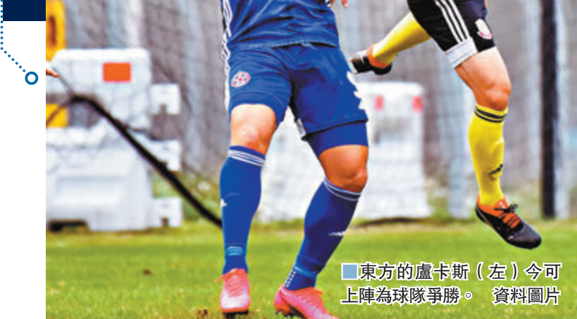
■東方的盧卡斯（左）今可上陣為球隊爭勝。

香港足球總會足球訓練中心編排了菁英盃分組賽，讓球季未致於完全中斷。然而由於訓練中心並非正規比賽場地，足總及港超球會經多番爭取後，今月終獲放寬，可以有限度地租用將軍澳運動場作賽。當中最受爭議的，就是球場不會開放更衣室淋浴設備，球員賽後要另外乘車返回訓練中心梳洗。