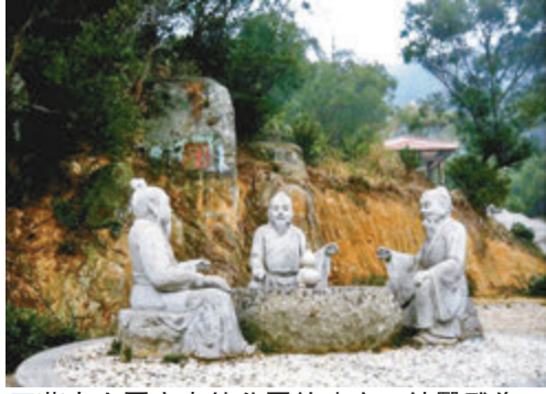
董奉山國家森林公園的建安三神醫雕像。

民心是桿秤。行醫濟世的董奉，用言行與舉止，贏得了百姓的普遍敬仰。因此，聞名遐邇，頌聲載道。可是，自古人生誰無死。神醫董奉，也不例外。吳天紀四年(280年)，董奉不幸逝