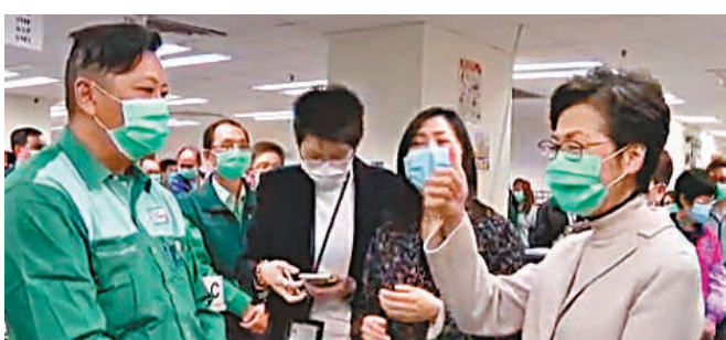
特首感謝郵務人員在疫情下不眠不休工作。

林鄭月娥讚賞郵務人員以民為本的服務精神,因應市面口罩供應緊張,主動找出並優先派遞載有口罩的郵包,以照顧市民的需要。縱然疫情令工作量有所增加,但郵務人員一直默默耕耘,亦已做好預防感染措施,全面恢復公共服務。她感謝郵務人員的努力,並鼓勵他們繼續為市民提供優質服務。