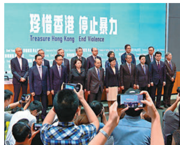
捐出一個月薪酬的共有44人,包括特首、各司局長等政治任命官員。

工聯會立法會議員亦將薪津捐出,由轄下職業發展服務處成立的「緊急失業慰問基金」,向於申請前半年曾受僱、失業一個月或以上及出現經濟困難者發放3,000元,津貼名額5,000個。