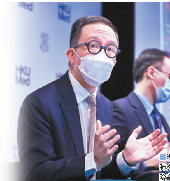
港大專家組統計最新新冠肺炎病例死亡率，長者的風險高3倍。