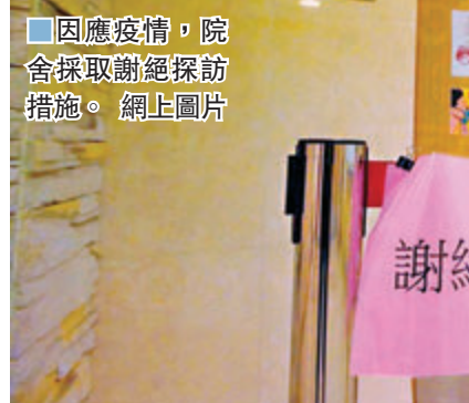
因應疫情，院舍採取謝絕探訪措施。網上圖片

專家之言 新型冠狀病毒疫情持續於全球擴散，中國工程院院士、香港大學新發傳染病國家重點實驗室主任袁國勇日前在接受《鳳凰衛視》專訪時表示，現時的疫情狀況已屬「全球大爆發」，韓國大邱市及意大利的疫情發展更令人擔憂，故全球各國都應像中國一樣做足防疫，才能使疫情緩解，否則疫情隨時比2003年「沙士」時嚴重得多。同時，香港特區政府應大量增加病毒測試，防止疫情在社區擴散。