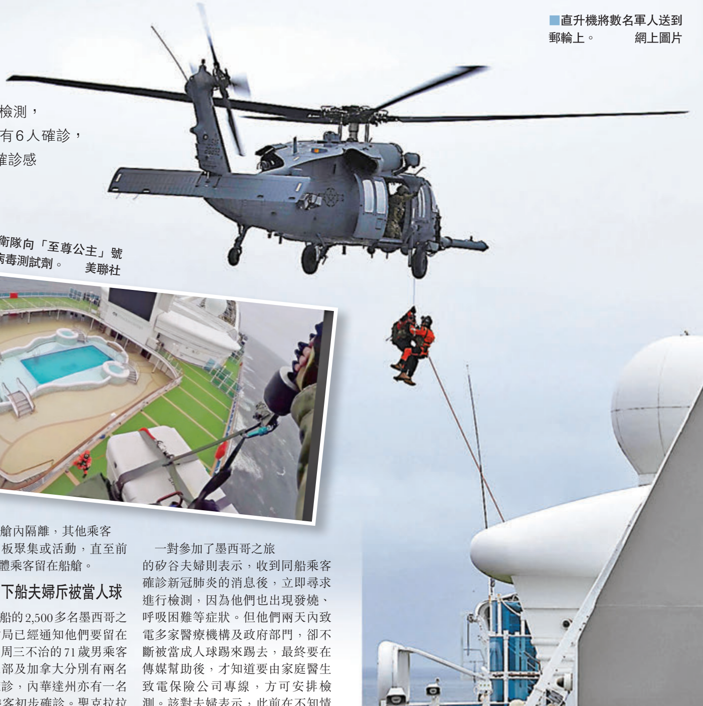
直升機將數名軍人送到郵輪上。

被視為「鑽石公主」號事件翻版的「至尊公主」號郵輪，昨日仍然停在美國加州外海，軍方前日向船上空投新冠病毒試劑，但暫時只有45名乘客接受檢測，最快在當地時間昨日有結果。「至尊公主」號上月接載的一批乘客中，已先後有6人確診，其中一人死亡，當局正為另一名下船後死亡的乘客進行測試。截至昨日，全球確診感染新冠病毒人數累計已經超過10萬人，中國以外個案亦快將突破2萬。