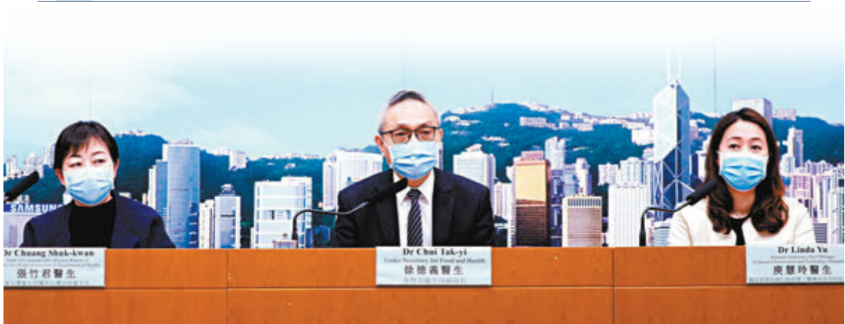
香港昨日新增三宗確診個案。