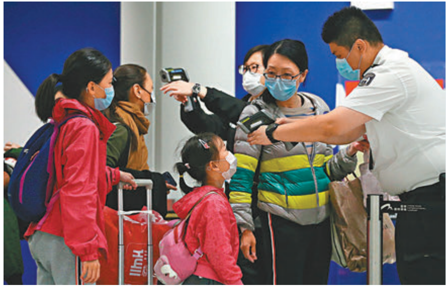
特区政府需因應疫情變化，調整抵港旅客的檢疫要求，並對疫情激增的國家和地區發旅遊警告。圖為香港國際機場為入境旅客量度體溫。