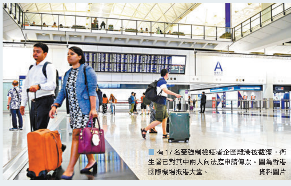
有17名受強制檢疫者企圖離港被截獲。衛生署已對其中兩人向法院申請傳票。圖為香港國際機場抵港大堂。資料圖片

即將他們送到檢疫營，並聯同警方展開調查。衛生署已對其中兩人向法院申請傳票，並已提交7人的證據供律政司考慮提出檢控。