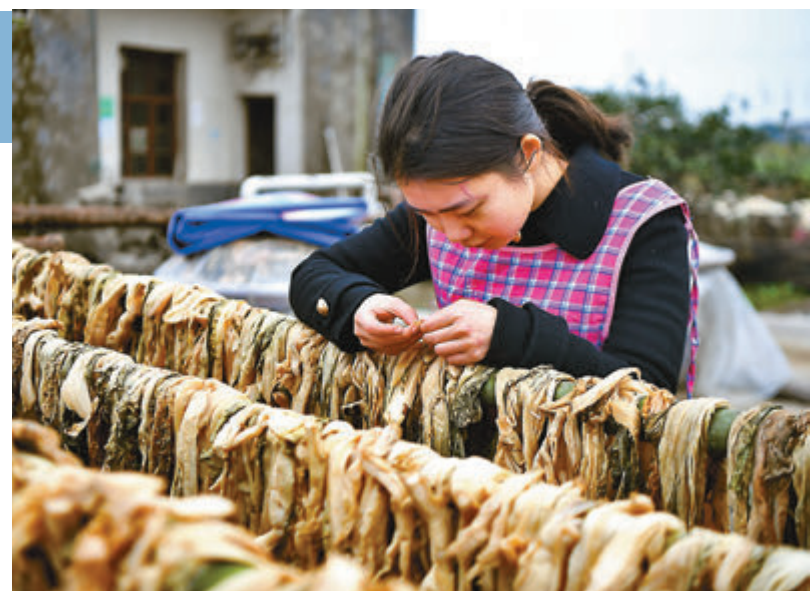
■湖南益陽張家塞鄉富民村盛產的芥菜所腌製的「擦菜子」是當地脫貧重要產業。

部分中共中央政治局委員、中央書記處書記出席座談會。國務院扶貧開發領導小組成員單位有關負責同志參加座談會。