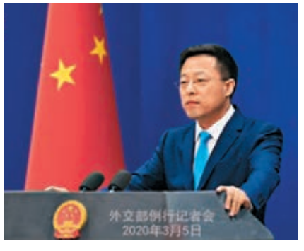
■外交部發言人趙立堅

病毒本身更危險。「在這個時候，個別人和媒體散佈這種毫無邏輯的言論，居心何在？」 他說，目前病毒源自何處，尚無定論。無論病毒源自哪裡，中國同其他出現疫情的國家一樣，都是病毒的受害者，都面臨阻擊疫情蔓延的挑戰。「2009年美國爆發的H1N1流感蔓延到214個國家和地區，當年就導致至少18,449人死亡，誰要求美國道歉了嗎？」 趙立堅表示，中國抗疫體現了一個負責任大國應有的擔當。在此次疫情防控中，中國力量、中國效率、中國速度受到了國際社會的廣泛讚譽。為了世界各國人民的健康和平安，中國人民也付出了巨大犧牲，作出了重大貢獻。全球170多個國家領導人和40多個國際和地區組織負責人向中國領導人來函致電、發表聲明表示慰問支持，對中國抗疫舉措及其積極成效以及為阻止疫情蔓延作出的巨大犧牲和貢獻予以高度肯定。世界衛生組織總幹事譚德塞指出，中國強有力的舉措