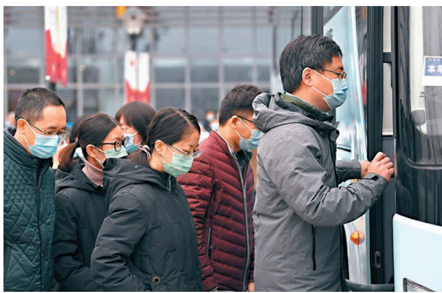
■中央應對新冠肺炎疫情工作領導小組會議強調，要進一步落實好關心關愛醫務人員各項措施，補助、津貼等不得按行政級別確定發放標準。圖為3月1日浙江杭州抗疫一線的部分醫護被安排健康休養。

做好飲食營養保障 會議強調，要進一步落實好關心關愛醫務人員各項措施，臨時工作補助、一次性慰問補助、衛生防疫津貼等要及時發放，向與患者直接接觸的接診、篩查、檢測、轉運、治療等一線醫務人員特別是救治重症患者的醫