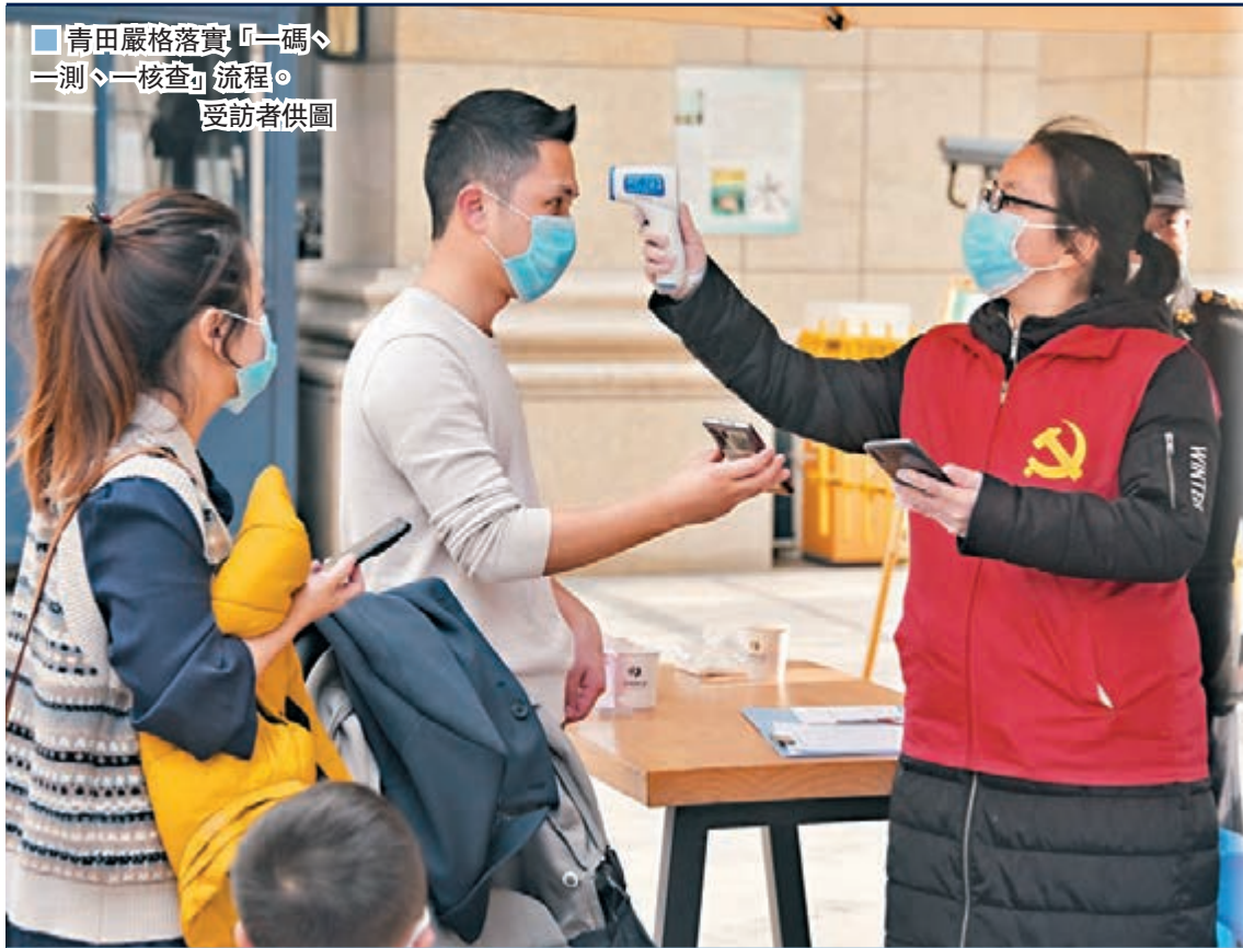
■青田嚴格落實「一碼一測一核一查」流程。