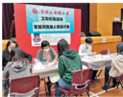
工聯會開展寄送藥品行動。

3月2日，譚女士收到由工聯會東莞中心用順豐轉寄來的藥品，她對工聯會提供的幫助和辦事效率表示由衷感謝，並稱快遞費用也均已免除。據了解，工聯會已收到第二批300多位港人提