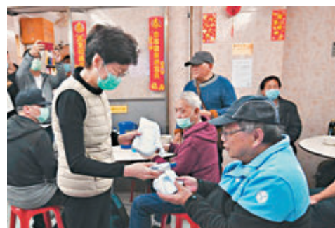
林鄭月娥昨日到露宿者行動委員會的服務中心派口罩等防疫用品。

工人交談時，感謝大家在這關鍵時期盡心盡力服務，並表示政府的「防疫抗疫基金」已預留款項，為清潔工友及保安人員等提供每月1,000元津貼，為期不少於4個月，協助他們加強個人和環境衛生。