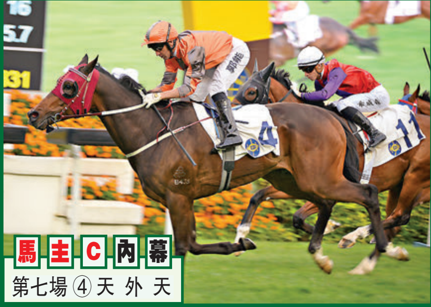
馬主C內幕 第七場④天外天

第六場、第三班、一六五〇米。「超趣」今季乃第二季在港服役，六戰跑獲兩亞兩季，事實上，第四仗在郭能胯下出戰同程，雖然前中段憑着一檔之利貼欄僵位，但轉彎入直路時移出最外疊望空蝕位不少，最終交出其強迫跑跑獲第二名。這一類自購馬勝在穩打穩紮，表現穩定，幕後鬥志又好，今仗續爭窄場一哩理由田泰安執韁，只要配合形勢總有