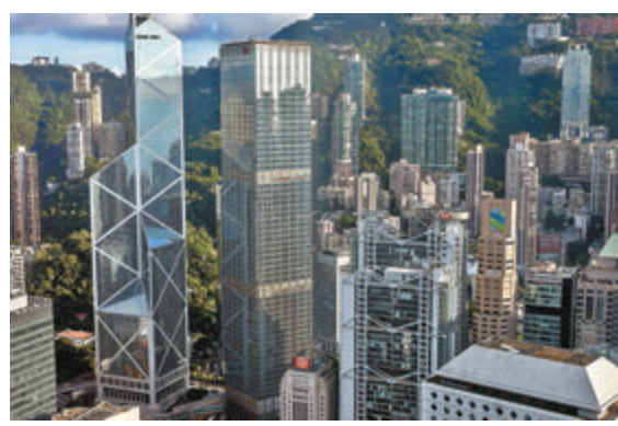
新冠肺炎疫情下，多間銀行推出應變措施，以加強在線服務。

香港文匯報訊(記者 馬翠媚)新冠肺炎疫情下，多間銀行推出應變措施，以加強在線服務，其中匯豐為指定理財客戶推出流動視像會議服務；中銀香港(2388)夥中銀人壽及中銀集團保險推出遙距投保服務，服務涵蓋合資格延期年金及自願醫保；星展香港亦推出數碼解決方案，為企業客戶提供非接觸模式的銀行服務。