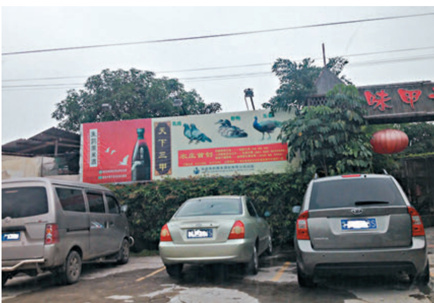
野生動物曾成為不少餐廳招攬顧客的招牌。

香港文匯報訊(記者 敖敏輝 廣州報道)廣州將從消費端嚴格防範野生動物違法行為。根據廣州市人大常委會法工委昨日掛網公告的《廣州市禁止濫食野生動物規定(草案徵求意見稿)》,酒樓、餐館、飯堂等餐飲經營者不得提供使用禁止食用的野生動物及其製品製作的食品,不得製作含有禁止食用的野生動物及其製品的名稱、別稱、圖案的招牌、菜單或者其他宣傳資料,用以招徠、誘導顧客。同時,不得以藥膳的名義食用或者生產經營禁止食用的野生動物及其製品。對消費者而言,食用在禁止之列的野生動物,將面臨最高兩萬元的罰款。