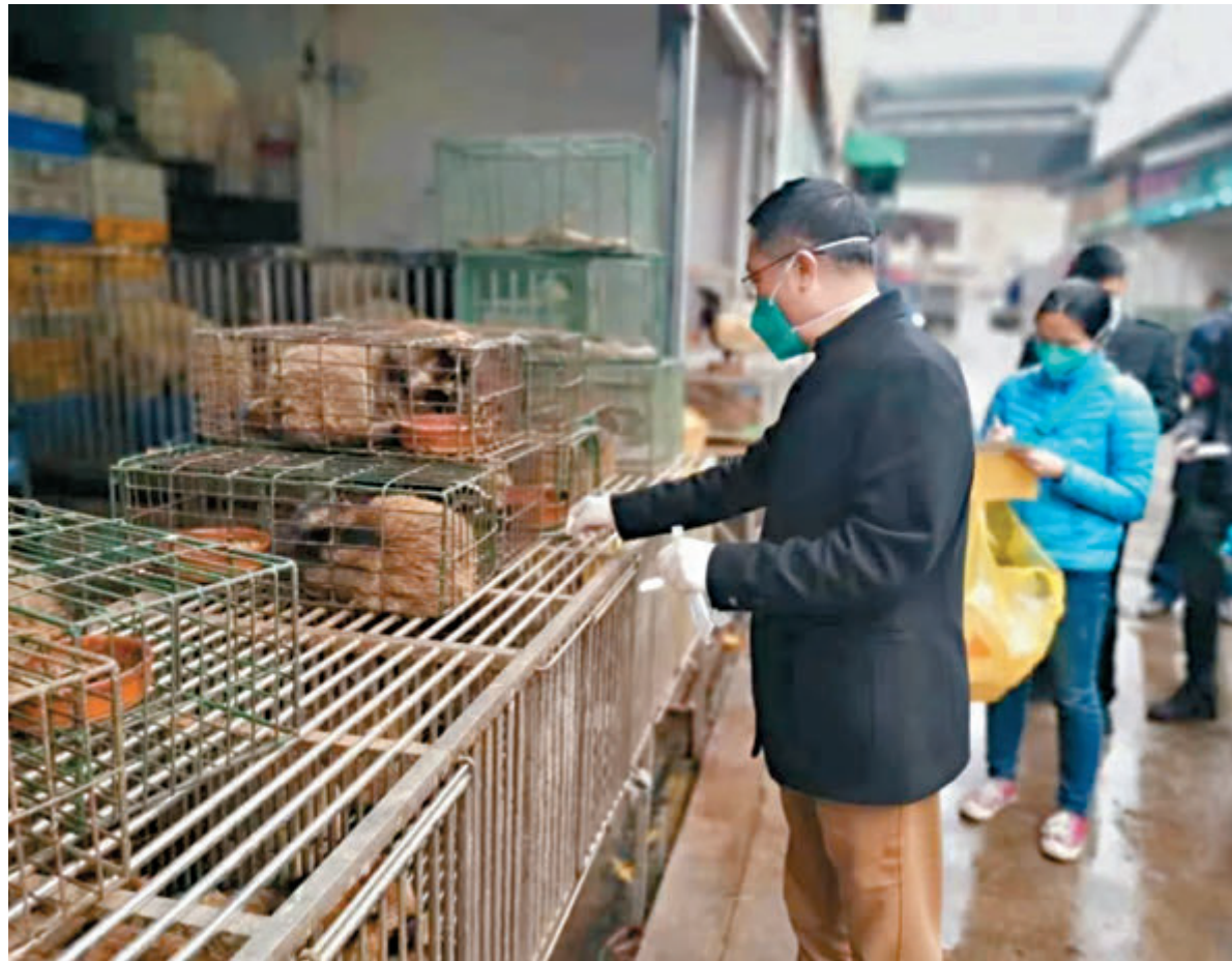
近日,廣東省市場監督管理局到佛山市開展活禽及動物經營市場安全專項檢查。