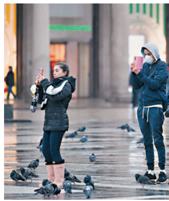
3月2日,在意大利米蘭,人們戴着口罩在街頭拍攝。

李軍華還表示,疫情是我們共同的敵人,病毒無情,人間有愛,中方願為意大利抗擊疫情提供力所能及的協助。他強調,中意傳統友好,面對疫情挑戰,雙方更應堅定信心、同舟共濟,以科學、理性的態度開展有效防治。