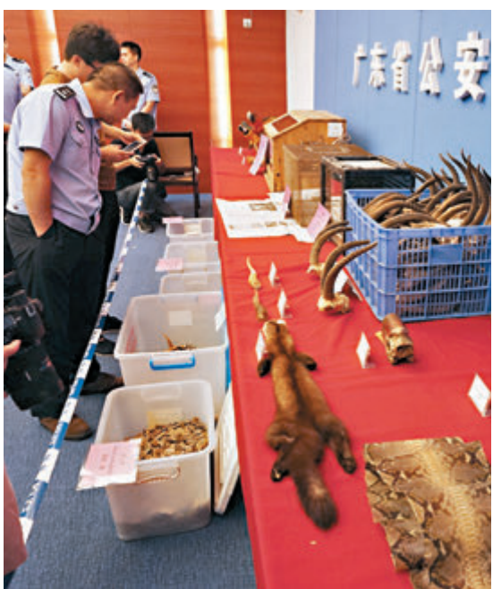
廣東警方加大對野生動物違法行為的打擊。圖為警方早前繳獲的野生動物交易品。

據介紹,本次專項行動將重點強化檢驗檢疫職能管理;加強各重點旅檢貨運口岸的查驗防控,針對野生動物及其製品跨境走私特點,對野生動物走私入境「購運儲銷」違法鏈條進行摸查;加強境外執法合作,強化綜合治理協作配合,會同廣東省有關部門對野生動物及其產品的主要交易地、集散地、消費地等重点區域實施有效整治。