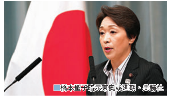
橋本聖子暗示東奧或延期。