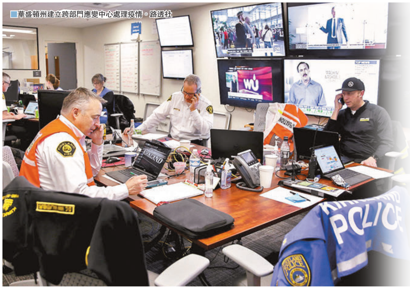
華盛頓州建立跨部門應變中心處理疫情。