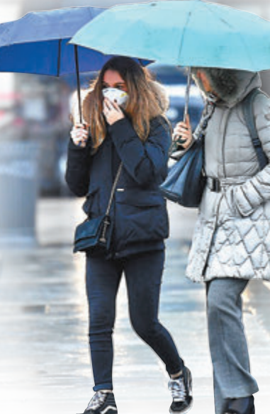
意大利新冠肺炎個案昨日急增至2,502宗。