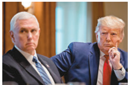
特朗普與藥廠開會。

彭斯會後則唱好研發工作，稱疫苗或可在6周內開始臨床測試，並可能在明年正式推出市場，藥物則料於今年夏季或初秋面世。彭斯強調國民的感染風險仍低，無法對美國國內實施旅遊限制，但會全面向來自韓國和意大利的入境人士檢疫。