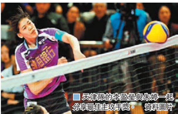
天津隊的朱婷與李盈莹一起分享最佳主攻手獎。 資料圖片

3月2日，中國排協選公佈的女排超級聯賽最佳陣容及最佳教練等評選結果，天津女排主帥王寶泉榮膺最佳教練。入選最佳陣容的7人中，4人來自天津，分別是主攻朱婷、李盈莹，二傳姚迪，副攻王媛媛，其餘3人分別是北汽副攻張宇、江蘇接應龔翔宇和恒大自由人林莉。■中新網