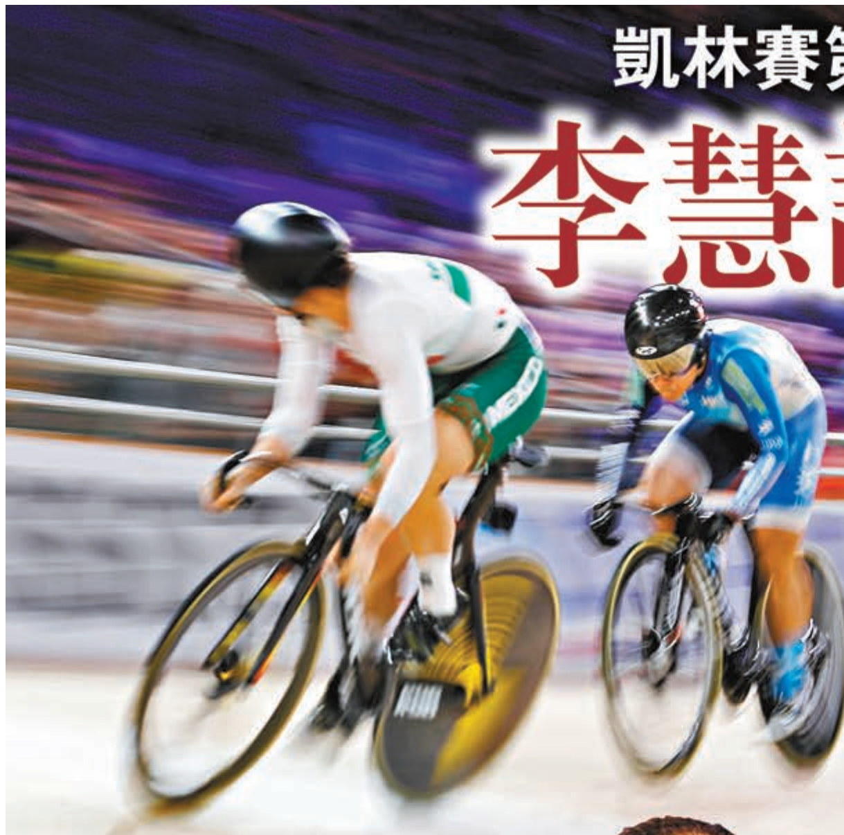
李慧詩(右)在到尾被對手爬頭，與獎牌擦身而過。

於「2020場地單車世界錦標賽」德國站女子爭先賽中，被終止連勝走勢的「牛下女車神」李慧詩(Sarah)，香港時間昨日凌晨於女子凱林賽決賽力戰下僅獲第4名，兩項賽事都衛冕失敗，今站僅獲得1面銅牌。不過今次失利對整體排名影響不大，相信仍有足夠積分獲得兩項賽事的東京奧運入場券。惟張敬樂及梁峻榮因未能完成男子麥迪遜賽事，很大機會緣盡東奧。