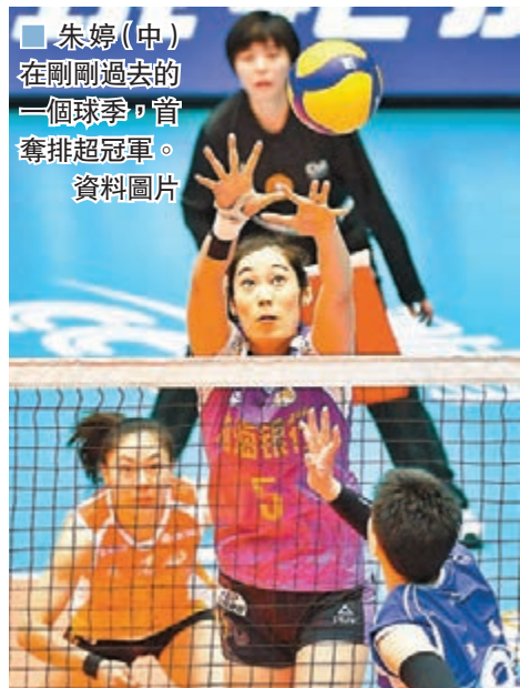
朱婷(中)在剛剛過去的一個球季，首奪排超冠軍。

中國排協昨日公佈了2019-2020賽季女排超級聯賽的最佳陣容以及MVP(最有價值球員)等獎項。朱婷毫無懸念獲得MVP，她還和李盈莹共同成為聯賽最佳主攻。作為世界頭號主攻手，朱婷留洋歸來的第一個賽季收穫很多榮譽，也留下了一些遺憾。